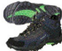
미테호른 / 211400005