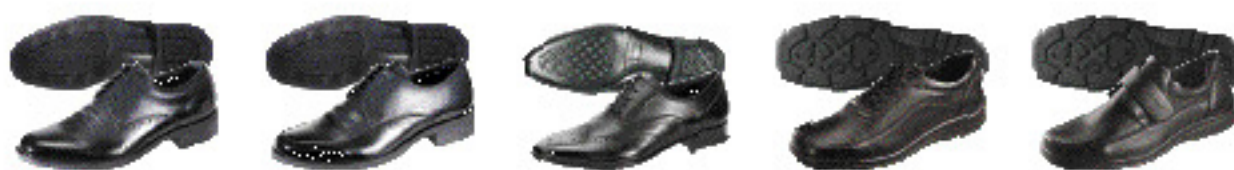
M1402 / 211300282 M1403 / 211300283 M1404 / 211500133 앤드 / 210875710 앤드2 / 210877510