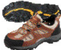
안전화M / 211100318