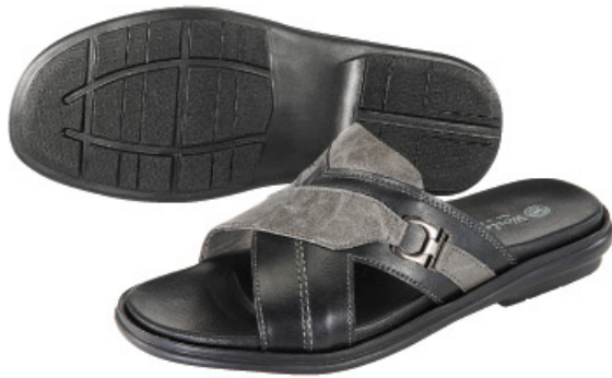
루카 슬리퍼 / 211300110

비조 장식을 포인트로 적용하였으며 우레탄 미드솔을 사용하여 착화감이 우수한 캐주얼 슬리퍼