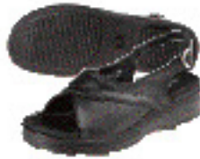
스탠드 / 211100172