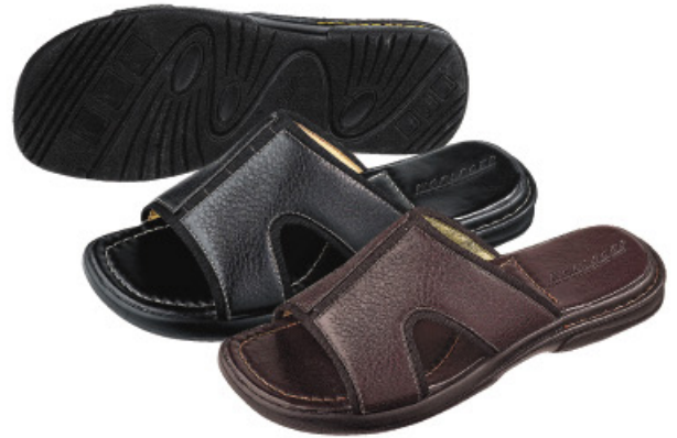
프라임 슬리퍼 / 210433710 • 210433810