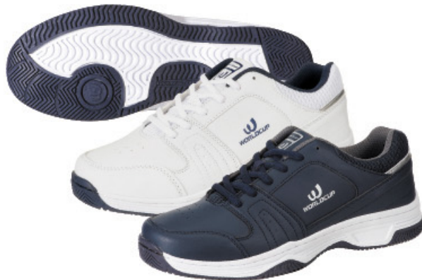
제코 헤리티지 / 211400016 • 211400017

Heritage 라인의 클래식한 디자인이 접목된 사계절 성인 남성화. 아리안스로 공법으로 마무리하여 내구성이 뛰어난 신발