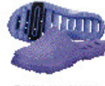
목실화2 / 211500081