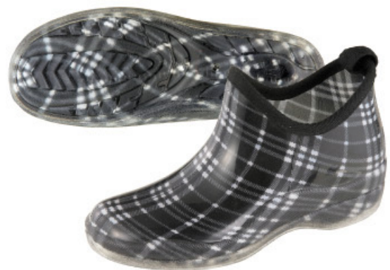
투명단화 장화 / 211200084

미끄럼방지 특수원료를 혼합하여 물기 있는 곳에서도 잘 미끄러지지 않으며 질기고 편안한 슬리퍼 ■색 상 : 곤색 ■소 재 : 갑피-PVC, 아웃솔-PVC ■사이즈 : 230 | 235 | 240 | 245 | 250 | 255