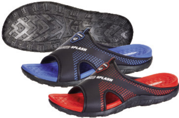
브랜드 아동화 / 211500090 • 211500091

발등을 감싸는 디자인으로 안정적인 착화가 가능하며 목신한 우레탄 중창을 사용하여 발이 편안한 아동슬리퍼 ■색 상 : 흑/청색 • 흑/적색 ■소 재 : 갑피-합성피혁, 아웃솔-PU+TPR창 ■사이즈 : 190 | 195 | 200 | 205 | 210 | 215 | 220 | 225 | 230 | 235 | 240