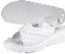
스탠드 / 211100173