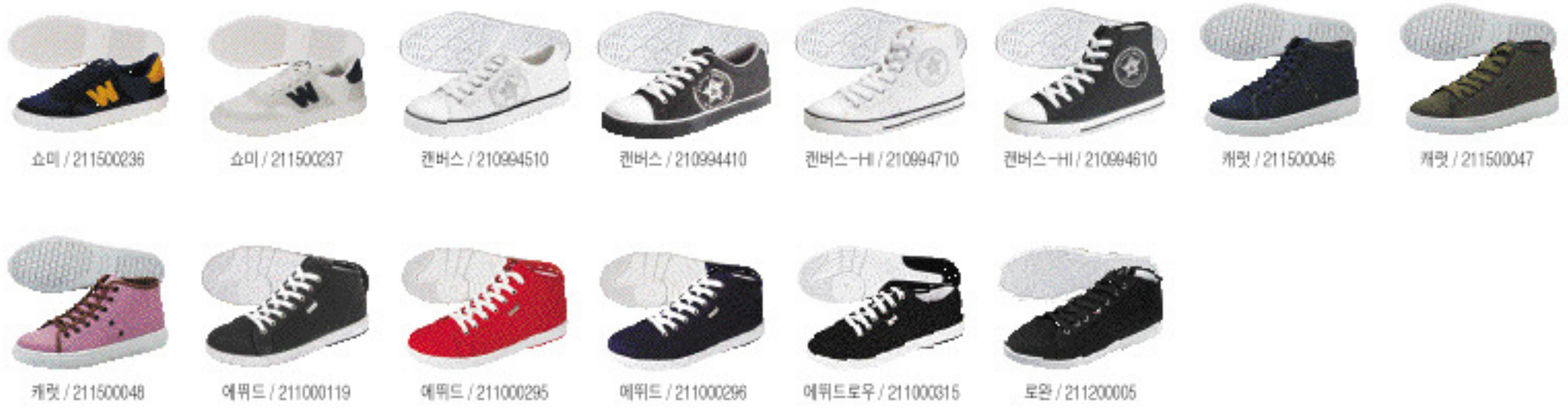
쇼미 / 211500236 쇼미 / 211500237 캔버스 / 210994510 캔버스 / 210994410 캔버스-Hi / 210994710 캔버스-Hi / 210994610 캐럿 / 211500046 캐럿 / 211500047 캐럿 / 211500048 에워드 / 211000119 에워드 / 211000295 에워드 / 211000296 에워드로우 / 211000315 로완 / 211200005