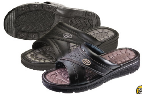
렉서스 슬리퍼 / 210745110 • 210745210

쿠션감 있는 EVA 지압 중창을 사용하여 발이 편안하며, 심플하고 세련된 갑피 디자인이 돋보이는 남성 슬리퍼