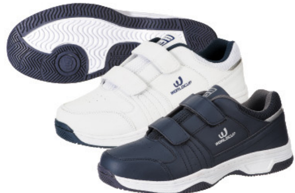
제코V 헤리티지 / 211400018 • 211400019

Heritage 라인의 클래식한 디자인이 접목된 벨크로 스타일의 사계절 성인 남성화. 아리안스로 공법으로 마무리하여 내구성이 뛰어난 신발