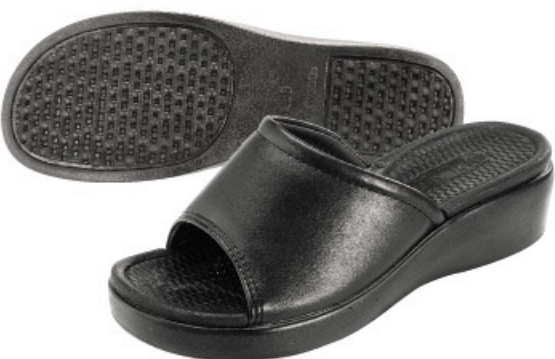
아모스 슬리퍼 / 211300129

우레탄 2중창 구조를 적용하여 착화감이 매우 뛰어난 심플한 갑피의 기본형 슬리퍼 (4cm굽높이)