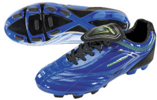
키크오프 전문화 / 211300035

트렌드를 반영한 화려한 Color를 포인트로 적용한 내구성이 뛰어난 고급 축구화