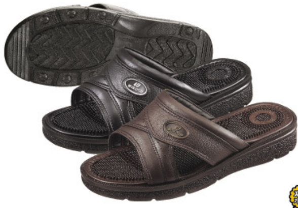
카네기 슬리퍼 / 210756010 • 210756110