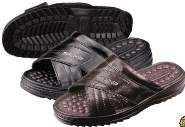
에쿠스 슬리퍼 / 210155610 • 210155710