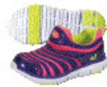
다이모N / 211500179