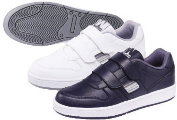
내셔널투09 헤리티지 / 210982610 • 210982710

클래식한 디자인에 내마모성이 뛰어난 RUBBER-OUTSOLE의 저가 스포츠화 (VELCRO-STYLE)