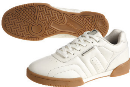
틀러S 헤리티지 / 211100001

클래식한 디자인에 가벼운 EVA 미드솔과 아리안스의 견고함이 조화된 사계절용 성인 편리화