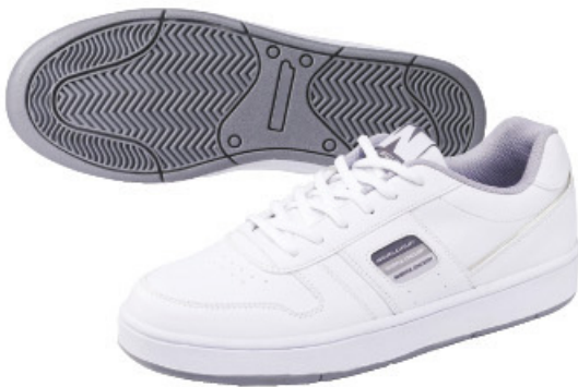
내셔널09 헤리티지 / 210982410

클래식한 디자인에 내마모성이 뛰어난 RUBBER-OUTSOLE의 저가 스포츠화 (LACE-STYLE)