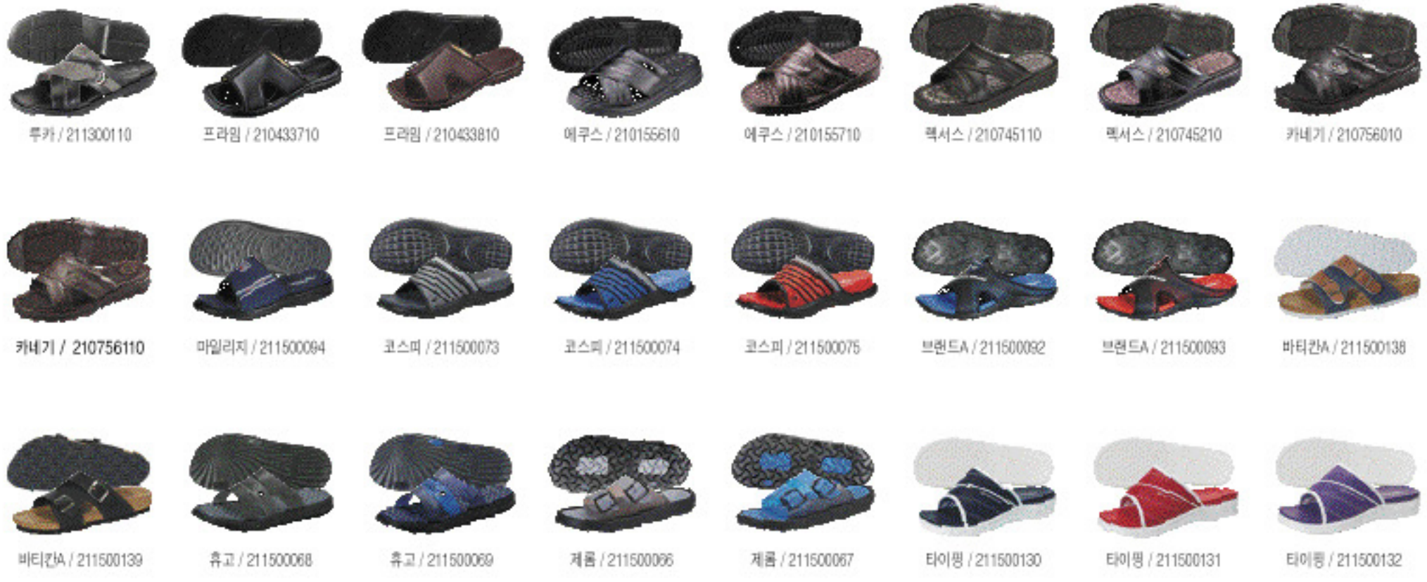
루카 / 211300110 프라임 / 210433710 프라임 / 210433810 에쿠스 / 210155610 에쿠스 / 210155710 맥서스 / 210745110 맥서스 / 210745210 카네기 / 210756010 카네기 / 210756110 마일리지 / 211500084 코스피 / 211500073 코스피 / 211500074 코스피 / 211500075 브렌드A / 211500092 브렌드A / 211500093 바티칸A / 211500138 바티칸A / 211500139 휴고 / 211500068 휴고 / 211500069 제롬 / 211500065 제롬 / 211500067 타이핑 / 211500130 타이핑 / 211500131 타이핑 / 211500132