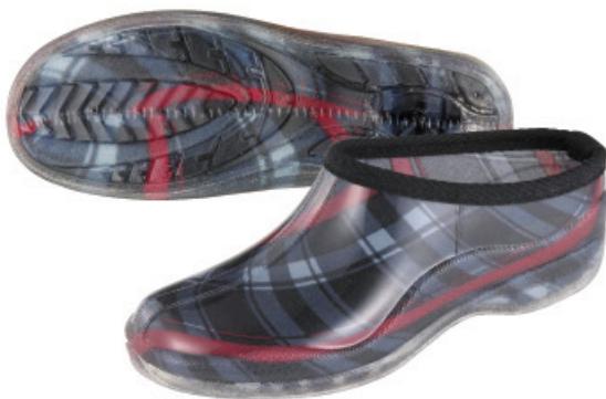
패션슬리퍼 장화 / 211200085

미끄럼방지 특수원료를 혼합하여 물기 있는 곳에서도 잘 미끄러지지 않으며, 귀여운 도트무늬를 적용하여 아동 착화에 적합한 아동장화 ■색 상 : 청색 • 핑크색 ■소 재 : 갑피-PVC, 아웃솔-PVC ■사이즈 : 160 | 170 | 180 | 190 | 200 | 210 | 220