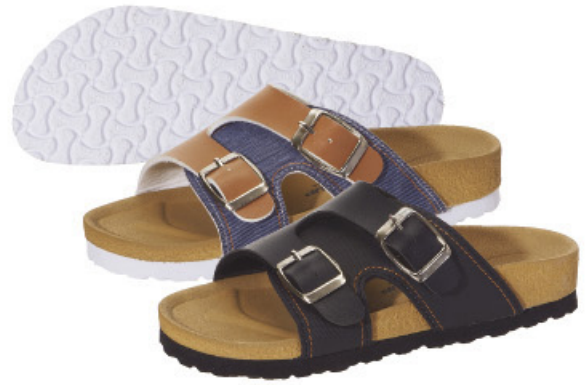
바티칸 아동화 / 211500136 • 211500137

발등을 감싸는 디자인으로 안정적인 착화가 가능하며 목신한 우레탄 중창을 사용하여 발이 편안한 아동슬리퍼 ■색 상 : 흑/청색 • 흑/적색 ■소 재 : 갑피-합성피혁, 아웃솔-PU+TPR창 ■사이즈 : 190 | 195 | 200 | 205 | 210 | 215 | 220 | 225 | 230 | 235 | 240