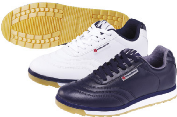
뉴탑건 라이프스타일 / 210879510 • 210879610

스티치로 감미 패턴을 최소화 하여 심플함을 강조, 측면 라벨을 포인트로 주어 고급스러움을 살린 스트리트화