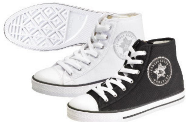
캔버스-Hi 캔버스 / 210994710 • 210994610

■색 상 : 아이보리 • 흑색 ■소 재 : 갑피-캔바스(면), 아웃솔-TPR창 ■사이즈 : 230 | 235 | 240 | 245 | 250 | 255 | 260 | 265 | 270 | 275