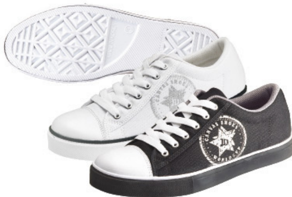
캔버스 캔버스 / 210994510 • 210994410

■색 상 : 백색 ■소 재 : 갑피-합성피혁+캔바스면, 아웃솔-고무창 ■사이즈 : 230 | 240 | 250 | 260 | 270 | 280