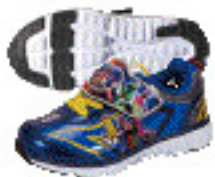
트레일포스라이트 / 211500175