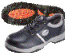
안전화LOW / 210764310