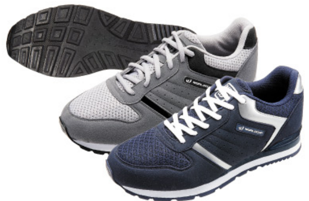
코스타2 라이프스타일 / 211300063 • 211300064

가죽 느낌의 인조스웨이드 소재를 적용하여 고급스러우며 통풍성이 뛰어난 기본형 EVA조각화