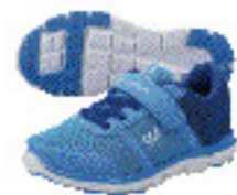
버츠비키즈 / 211500021