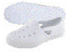
EVA실내화 / 211200104