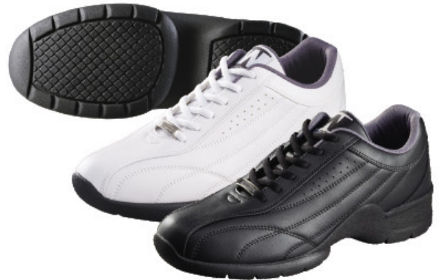
베이직08 라이프스타일 / 210878310 • 210878410