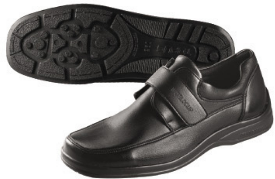
앤드2 캐주얼 / 210877510

U팁을 적용한 심플한 디자인에 10mm 인솔을 사용하여 착화감이 매우 우수한 PU창을 사용한 경량 캐주얼화 • 심플한 디자인에 탈착이 편리한 벨크로를 적용하였으며 10mm 인솔과 PU창을 사용한경량 캐주얼화