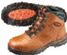
안전화 / 210746710