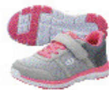
버츠비키즈 / 211500022