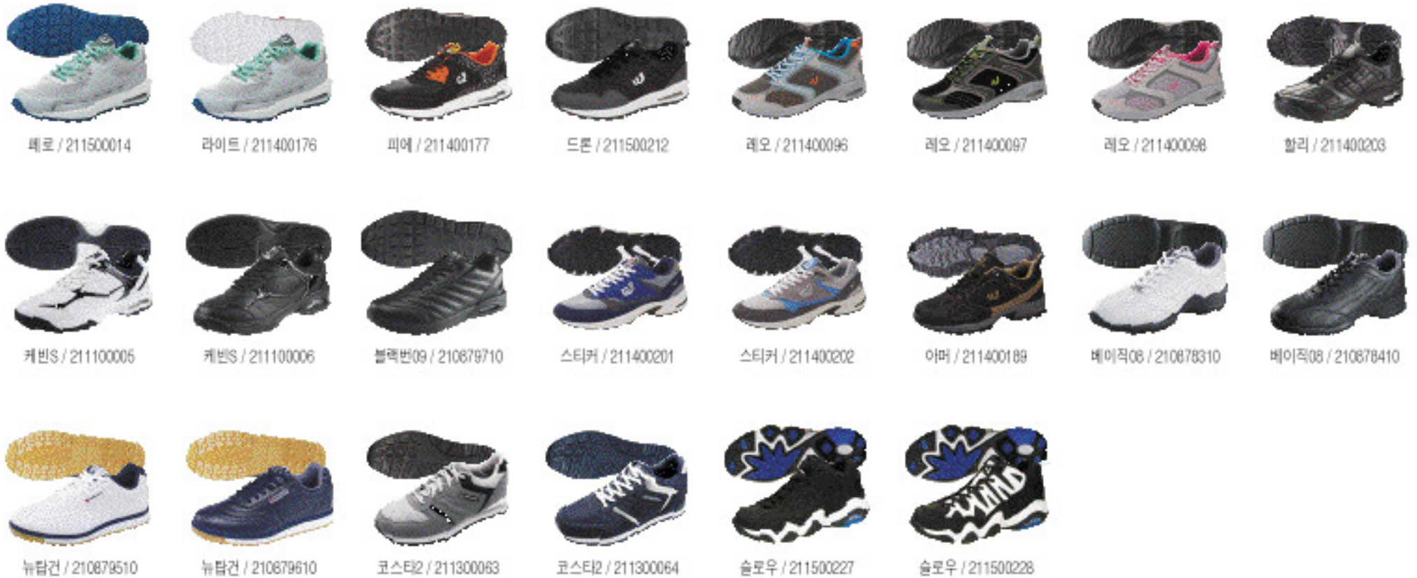
베로 / 211500014 라이트 / 211400176 피에 / 211400177 드론 / 211500212 레오 / 211400096 레오 / 211400097 레오 / 211400098 할리 / 211400203 케빈S / 211100005 케빈S / 211100006 블랙번09 / 210879710 스티커 / 211400201 스티커 / 211400202 아머 / 211400189 베이직08 / 210878310 베이직08 / 210878410 뉴탑건 / 210879510 뉴탑건 / 210879610 코스타2 / 211300063 코스타2 / 211300064 슬로우 / 211500227 슬로우 / 211500228