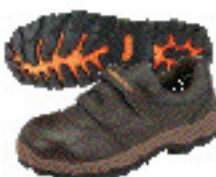
안전화V / 211100316