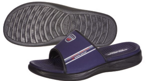
마일리지 슬리퍼 / 211500094

우레탄 중창으로 쿠셔닝이 좋으며 클래식한 색감이 돋보이는 고급 남성 슬리퍼