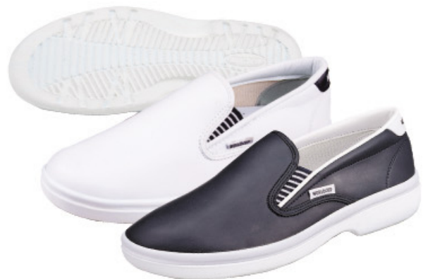
코사인 헤리티지 / 210062210 • 210062310