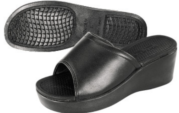
아모스H 슬리퍼 / 211300130

우레탄 2중창 구조를 적용하여 착화감이 매우 뛰어난 심플한 갑피의 기본형 슬리퍼 (6cm굽높이)