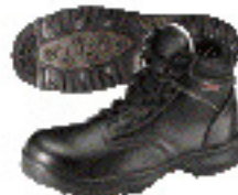
안전화H / 210999925