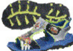
다이노포스샌들 / 211500114