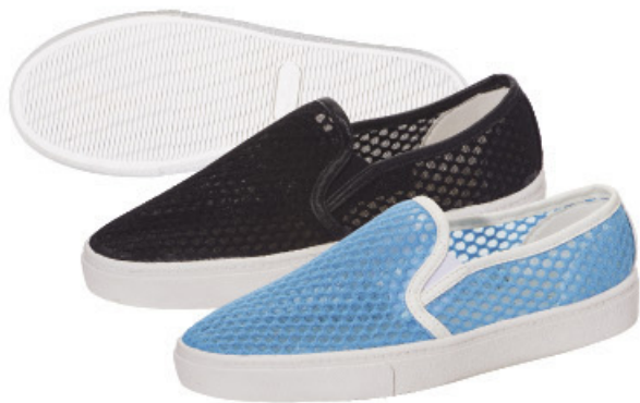
• 옥타곤 • 캐주얼 / 211400147 • 211400148

통기성이 좋은 메쉬무늬 디테일에 갑피와 아웃솔의 컬러 대비로 심플한 디자인을 강조한 메쉬 슬립온