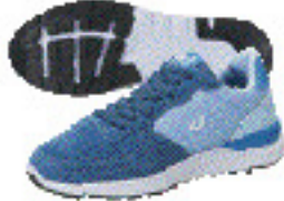
타이곤W / 211500089