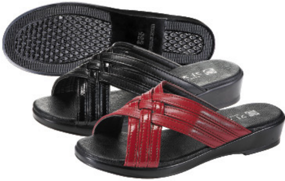
엘리사 슬리퍼 / 211400127 • 211400128

발등을 감싸는 X자형의 편안한 디자인을 적용하여 시원함과 착화감이 우수한 여성용 슬리퍼