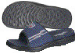
마일리지 / 211500094