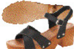
러츠HI / 211400111