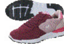
타이곤W / 211500088