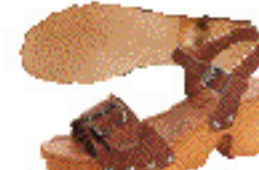
토름HI / 211400118