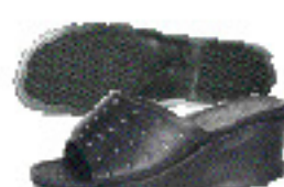
데이즈HI / 211500096