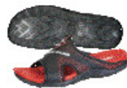
브랜드A / 211500093