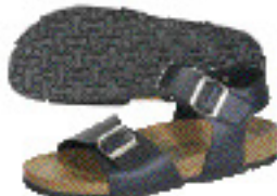
플로리다 / 211500163