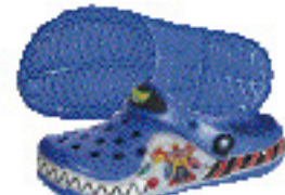
티라노링슬리퍼 / 211500072