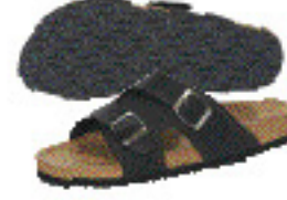
바티칸A / 211500139