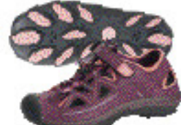
라스트W / 211500145