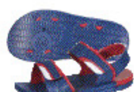
스쿠터 / 211500119