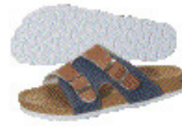
바티칸A / 211500138