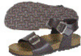
플로리다 / 211500164