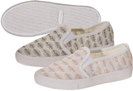
시스루 캐주얼 / 211400149 • 211400150

망사 재질의 레이스 느낌이 나는 갑피 소재로 여성스러우면서도 시원하게 신을 수 있는 착급 2cm에 1cm 스펀지 인솔로 편안하게 신을 수 있는 슬립온