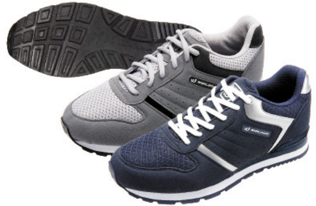
코스타2 라이프스타일 / 211300063 • 211300064

스티치로 감미 패턴을 최소화 하여 심플함을 강조, 측면 라벨을 포인트로 주어 고급스러움을 살린 스트리트화 ■색 상 : 백색 • 곤색 ■소 재 : 갑피-합성피혁, 아웃솔-EVA+TPR창 ■사이즈 : 250 | 255 | 260 | 265 | 270 | 275 | 280