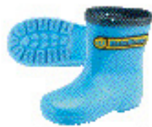
아동장화 / 211800149