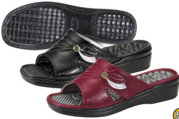
클로이 슬리퍼 / 211600162 • 211600163

EVA 지압 중창에 사이드 오픈으로 옆선의 나뭇잎 포인트 디자인의 쿠셔닝 좋은 굽 높이 3.5cm 슬리퍼