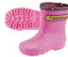
아동장화 / 211800150