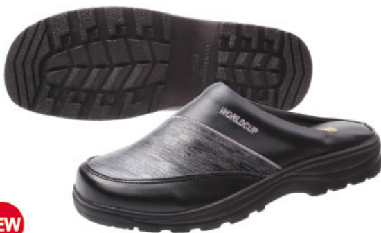
오픈스 슬리퍼 / 211600283