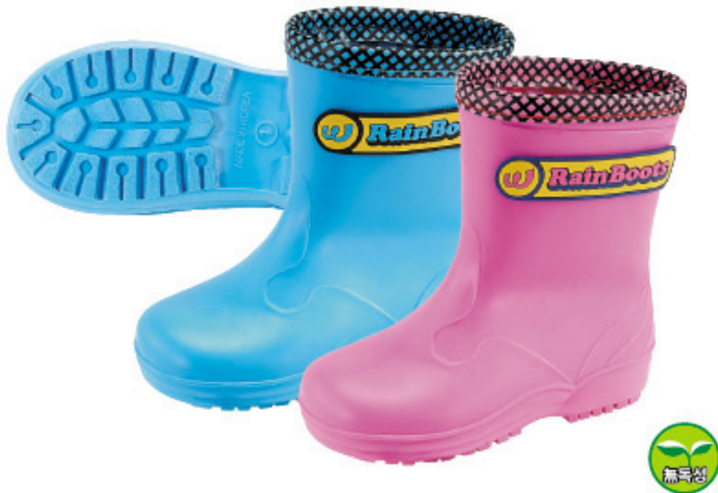
아동장화 장화 / 211300149 • 211300150