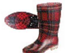
미션장화 / 211400043