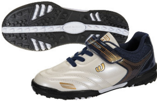
마지스타 아동화 / 211600012

발이 구부러지는 면을 따라 스티칭을 주어 유연성을 강화하고 2중느낌의 에나멜을 사용하여 입체감 있는 느낌을 준 축구화 타입의 아동화로 스타드 모양을 낸 아웃솔을 사용하여 접지력이 우수함.