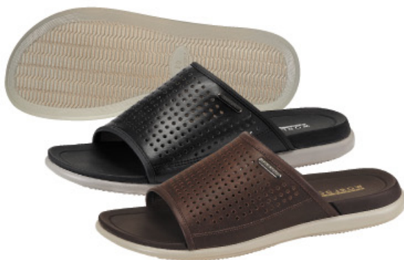
리얼 슬리퍼 / 211600120 • 211600121

레이저커팅 기법이 적용된 트랜디함이 돋보이는 디자인과 통기성과 착화감이 우수한 남성인 슬리퍼