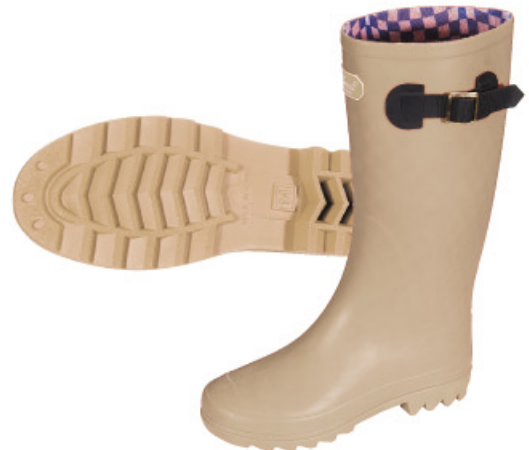
패션레인부츠 장화 / 211300155

무광재질에 벨트장식 포인트를 주어 고급스러우면서도 심플한 멋이 돋보이며 두께감 있는 인솔을 사용하여 착화감이 우수한 패션레인부츠