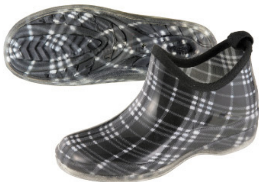
투명단화 장화 / 211200084

미끄럼방지 특수원료를 혼합하여 물기 있는 곳에서도 잘 미끄러지지 않으며 질기고 편한 정원화