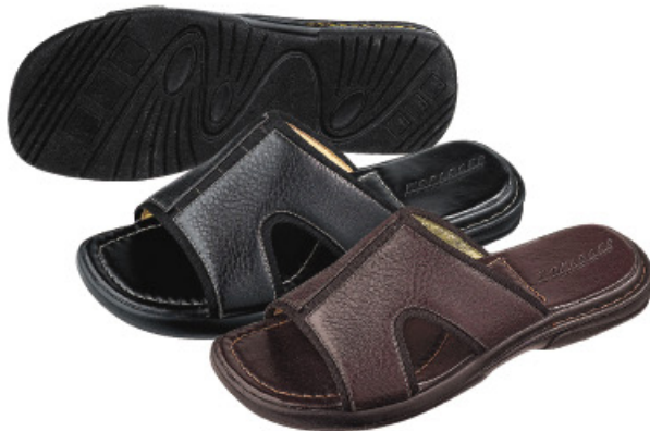
프라임 슬리퍼 / 211400279 • 211400280