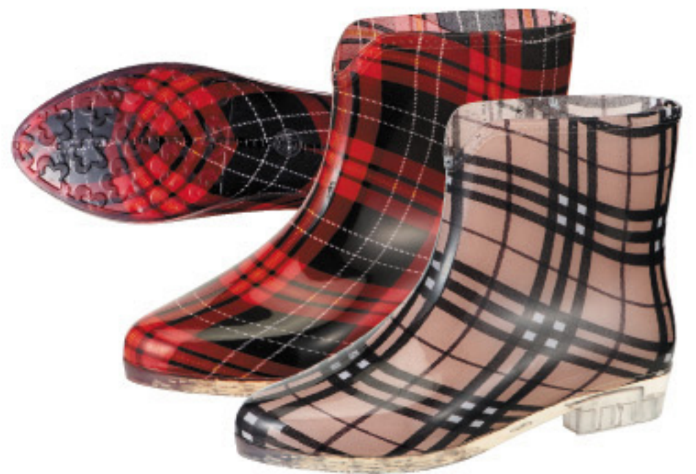
패션여화 장화 / 211400045 • 211400046

앵글 기장으로 착화가 용이하고 미끄럼방지창으로 착용감 편한 체크 무늬 패션 여화