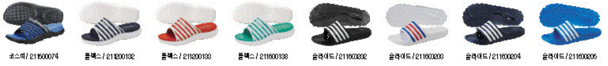
코스피 / 211600074 콤플렉스 / 211200132 콤플렉스 / 211200133 콤플렉스 / 211600138 슬라이드 / 211600202 슬라이드 / 211600203 슬라이드 / 211600204 슬라이드 / 211600205