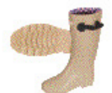
미션레인부츠 / 211800155