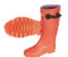
미션레인부츠 / 211800154