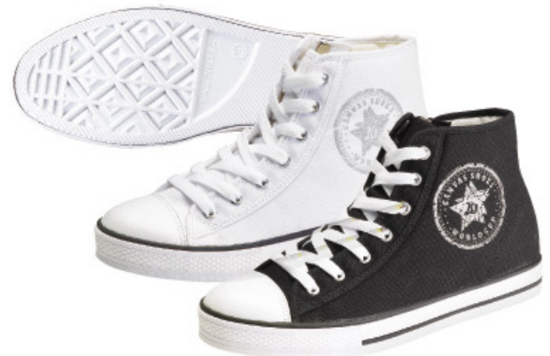
캔버스-Hi 캔버스 / 210994710 • 210994610

■색 상 : 아이보리 • 흑색 ■소 재 : 갑피-캔버스(면), 아웃솔-TPR창 ■사이즈 : 230 | 235 | 240 | 245 | 250 | 255 | 260 | 265 | 270 | 275