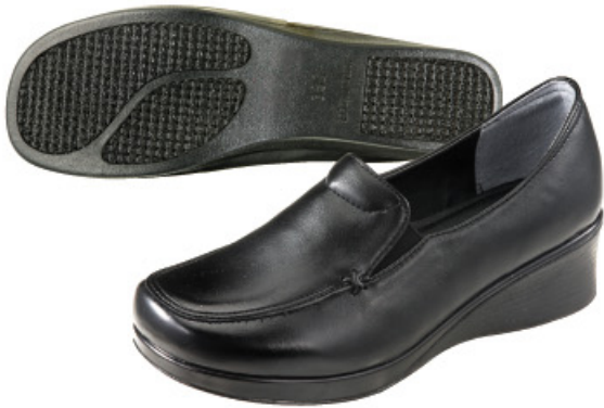
아이시스 캐주얼 / 211200063