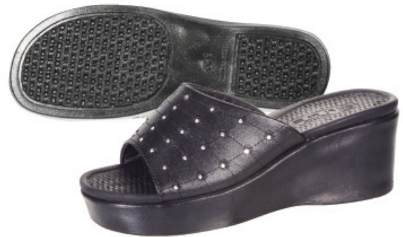
데이즈비 슬리퍼 / 211500096

어머 보석장식으로 여성스러움을 강조한 우레탄 이중창의 쿠셔닝과 착화감이 뛰어난 굽 6.5cm의 여성슬리퍼