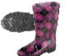
미션장화 / 211200074