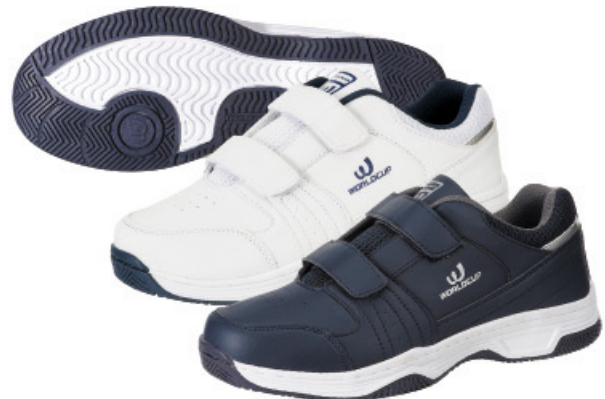
제코V 헤리티지 / 211400018 • 211400019

Heritage 라인의 클래식한 디자인이 접목된 벨크로 스타일의 사계절 성인 남성화. 아리안스로 공법으로 마무리하여 내구성이 뛰어난 신발