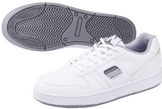
내셔널09 헤리티지 / 210982410

클래식한 디자인에 내마모성이 뛰어난 RUBBER-OUTSOLE의 저가 스포츠화 (LACE-STYLE)