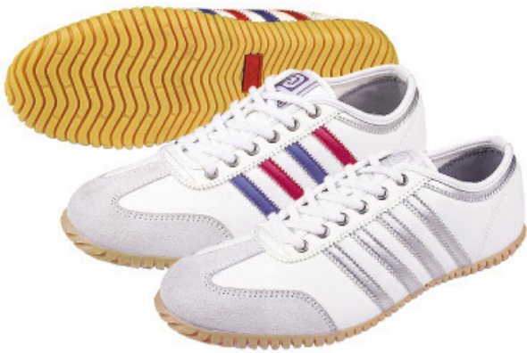
호크스 스니커즈 / 210542910 • 210543010

마모력이 뛰어난 생고무 아웃솔 사용 및 측면 4선 장식을 적용한 기본형 스니커즈