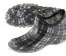
두명단화 / 211200084