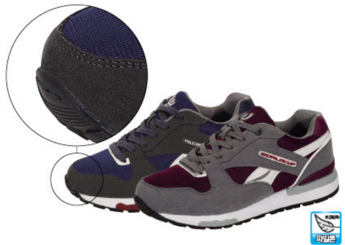
리바로 스니커즈 / 211500204 • 211500205

클래식한 패턴에 트렌디한 색감을 접목시켜 헤리티지 감성을 모던하게 구현한 갑피에 파일론 창의 적용으로 가볍고 착화감이 우수한 패션 조깅화