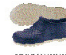
코드하이 / 211600152