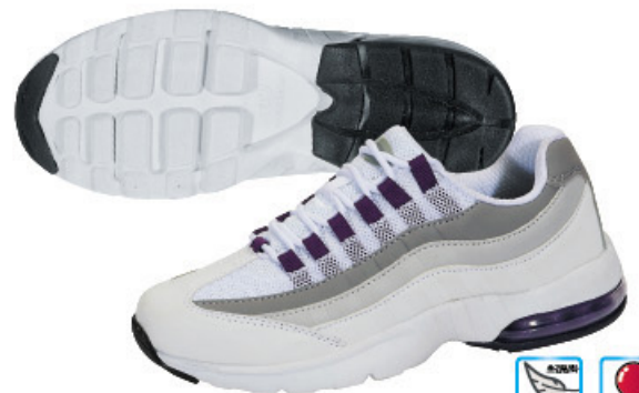
그란데W 라이프스타일 / 211600027

튼튼으로 레이어드된 모던하면서 세련된 갑피 디자인에 가벼운 에어창을 접목시켜 가볍고 착화감이 우수한 스포츠화