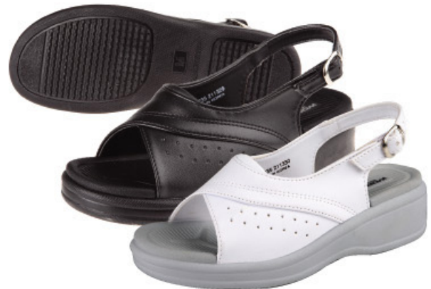
스탠드 캐주얼샌들 / 211100172 • 211100173

장시간 착화시에도 발에 무리가 없고, 소프트한 우레탄 소재의창 사용으로 가벼워서 활동하기에 편안한 4cm굽높이의 심플한 디자인의 샌들