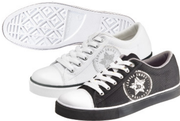
캔버스 캔버스 / 210994510 • 210994410

■색 상 : 적색 ■소 재 : 갑피-캔버스면, 아웃솔-PU창 ■사이즈 : 230 | 235 | 240 | 245 | 250