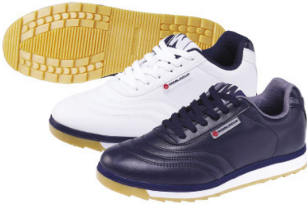
뉴탑건 라이프스타일 / 210879510 • 210879610

스티치로 감미 패턴을 최소화 하여 심플함을 강조, 측면 라벨을 포인트로 주어 고급스러움을 살린 스트리트화 ■색 상 : 백색 • 곤색 ■소 재 : 갑피-합성피혁, 아웃솔-EVA+TPR창 ■사이즈 : 250 | 255 | 260 | 265 | 270 | 275 | 280