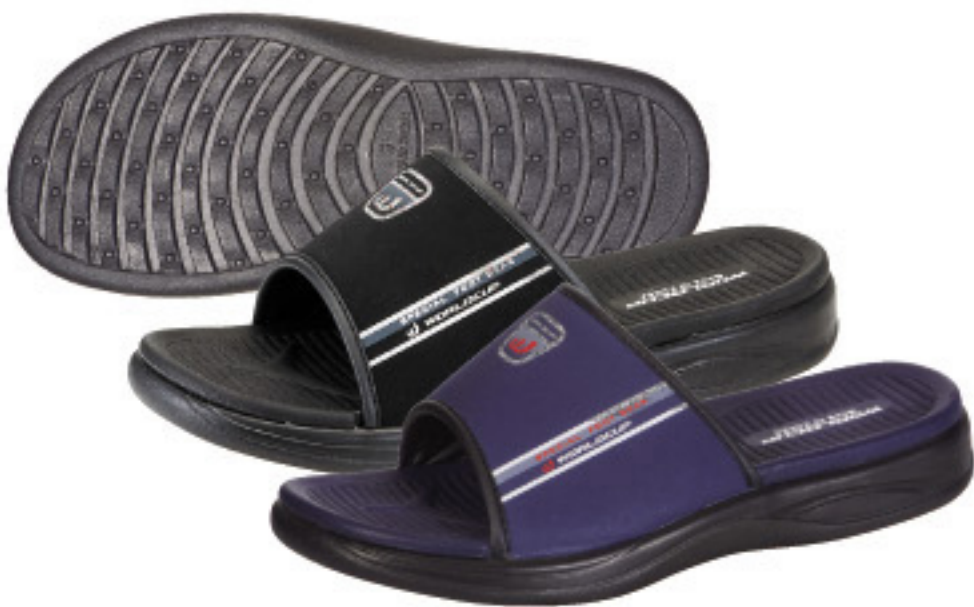
마일리지 슬리퍼 / 211600134 • 211500094

우레탄 중창으로 쿠셔닝이 좋으며 클래식한 색감이 돋보이는 고급 남성 슬리퍼