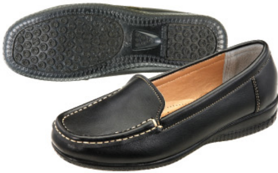
플라인 캐주얼 / 211200065

심플한 디자인에 메탈과 큐빅으로 구성된 비조 장식으로 포인트를 준 굽 3cm의 여성 캐주얼화