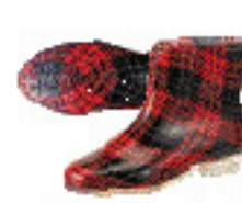
미션여화 / 211400046