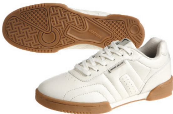
틀러S 헤리티지 / 211100001

클래식한 디자인에 가벼운 EVA 미드솔과 아리안스의 견고함이 조화된 사계절용 성인 편리화