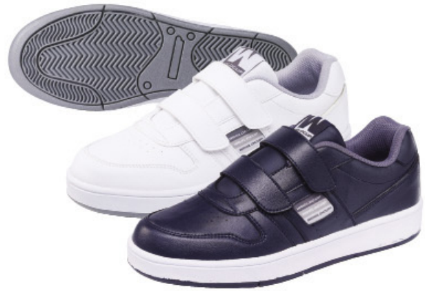
내셔널투09 헤리티지 / 210982610 • 210982710

클래식한 디자인에 내마모성이 뛰어난 RUBBER-OUTSOLE의 저가 스포츠화 (VELCRO-STYLE)