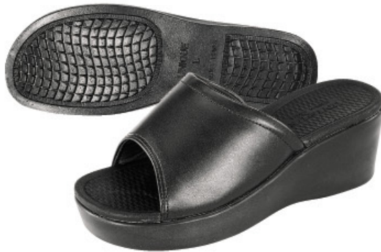
아모스비 슬리퍼 / 211300130

우레탄 2중창 구조를 적용하여 착화감이 매우 뛰어난 심플한 갑피의 기본형 슬리퍼 (6cm굽높이)