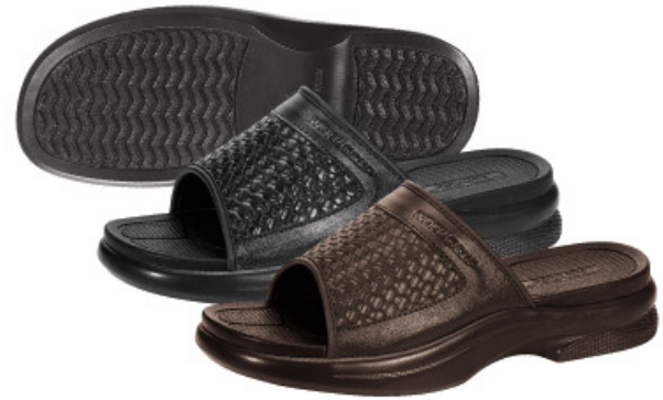
마일로 슬리퍼 / 211600032 • 211600033

부분 벌집패턴의 사용으로 클래식함을 강조한 갑피에 폭신하고 밀량한 우레탄 아웃솔을 접목시켜 장시간 착용시에도 편안한 사무용 슬리퍼