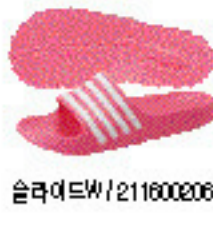
슬라이드W / 211600206