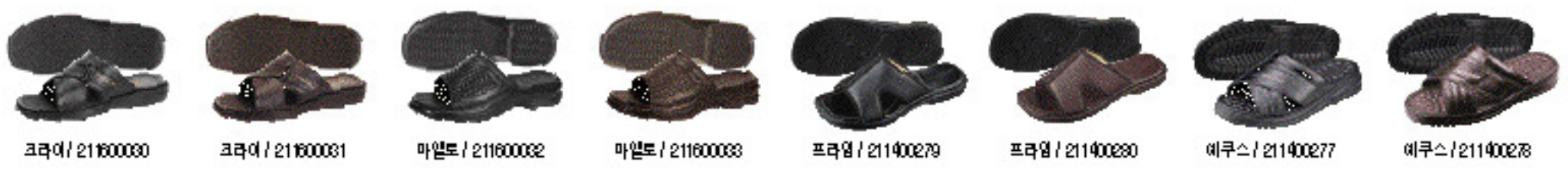
크라이 / 211600030 크라이 / 211600031 마일드 / 211600032 마일드 / 211600033 프라임 / 211400279 프라임 / 211400280 에쿠스 / 211400277 에쿠스 / 211400278