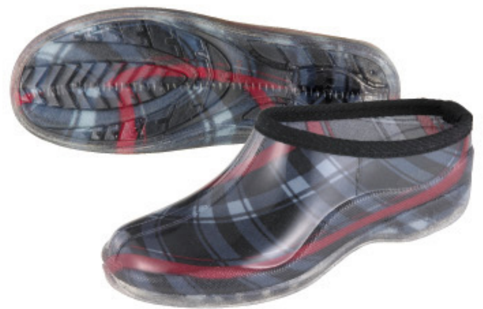
패션슬리퍼 장화 / 211200085

미끄럼방지 특수원료를 혼합하여 물기 있는 곳에서도 잘 미끄러지지 않으며 질기고 편한 슬리퍼