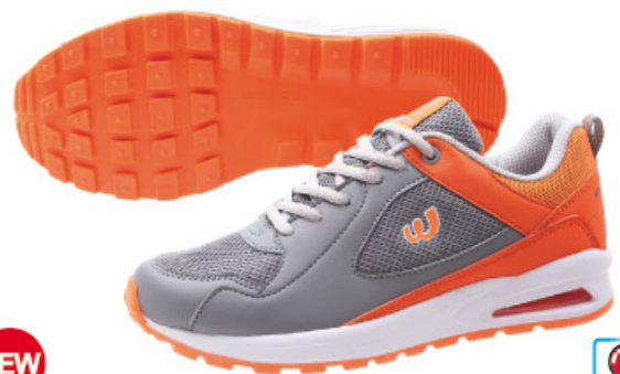
헬름W 라이프스타일 / 211600263

통기성이 뛰어난 메쉬 소재 적용으로 통풍성이 뛰어나며 에어창을 사용하여 안정적인 착화감을 선사하는 조깅화