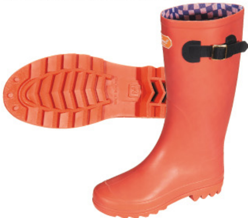
패션레인부츠 장화 / 211300154

무광재질에 벨트장식 포인트를 주어 고급스러우면서도 심플한 멋이 돋보이며 두께감 있는 인솔을 사용하여 착화감이 우수한 패션레인부츠