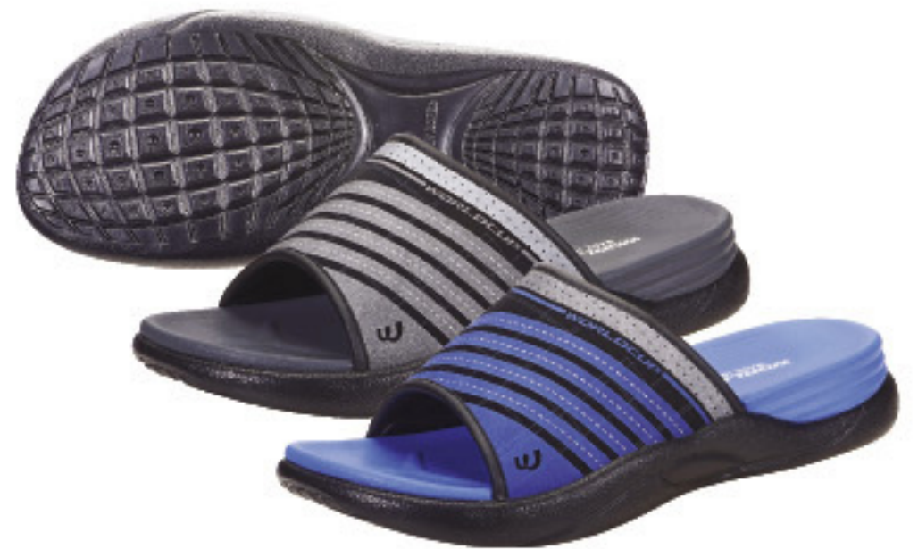
코스피 슬리퍼 / 211500073 • 211500074

세련된 갑피 디자인과 컬러 포인트 디테일이 돋보이는 가볍고 착화감이 뛰어난 다용도 스포츠 슬리퍼