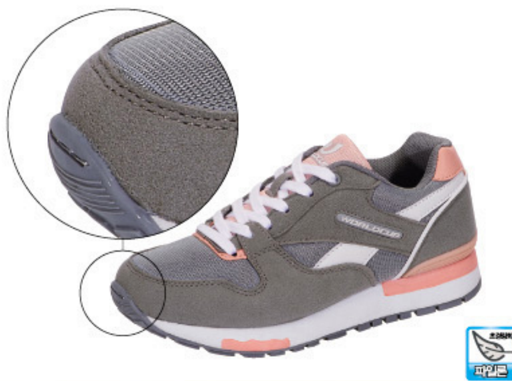
리바로W 스니커즈 / 211500195

클래식한 패턴에 트렌디한 색감을 접목시켜 헤리티지 감성을 모던하게 구현한 갑피에 파일론 창의 적용으로 가볍고 착화감이 우수한 패션 조깅화