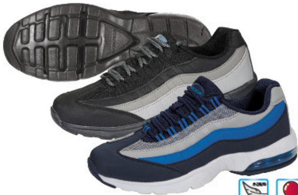
그란데 라이프스타일 / 211600025 • 211600026

튼튼으로 레이어드된 모던하면서 세련된 갑피 디자인에 가벼운 에어창을 접목시켜 가볍고 착화감이 우수한 스포츠화