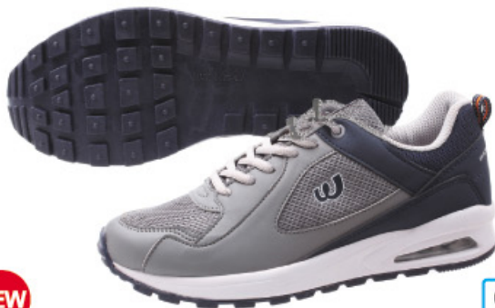
헬름 라이프스타일 / 211600262

통기성이 뛰어난 메쉬 소재 적용으로 통풍성이 뛰어나며 에어창을 사용하여 안정적인 착화감을 선사하는 조깅화