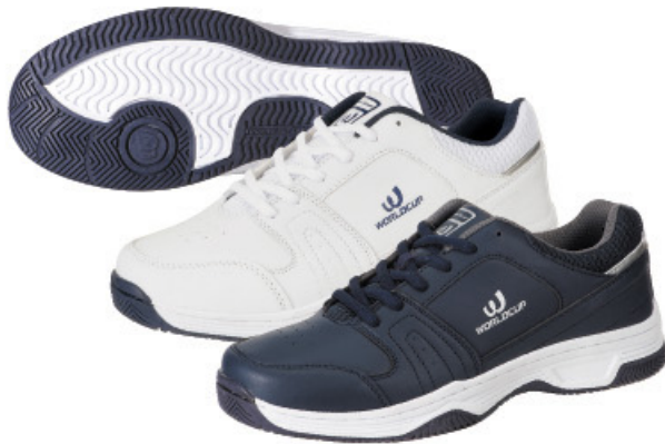
제코 헤리티지 / 211400016 • 211400017

Heritage 라인의 클래식한 디자인이 접목된 사계절 성인 남성화. 아리안스로 공법으로 마무리하여 내구성이 뛰어난 신발