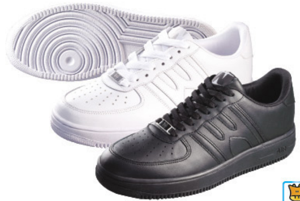
뉴트럴 스니커즈 / 210866610 • 210877110

천연가죽을 사용하여 부드럽고 고급스러운 갑피. 기본형으로 어떤 옷이든 코디가 용이한 Jr.스트리트화