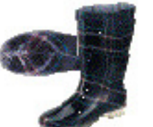
미션장화 / 211400044