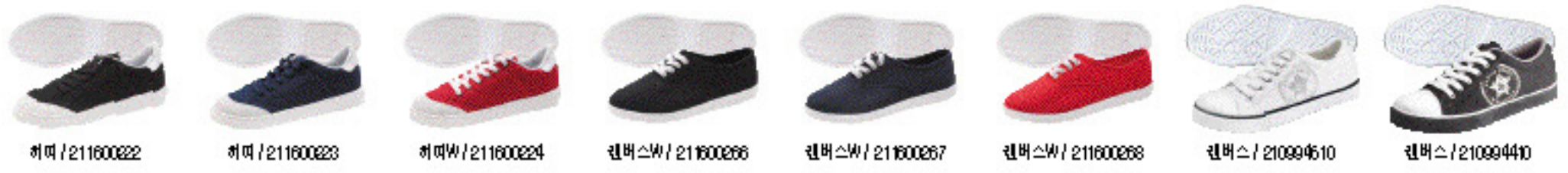
히피 / 211600222 히피 / 211600223 히피W / 211600224 캔버스W / 211600266 캔버스W / 211600267 캔버스W / 211600268 캔버스 / 210994610 캔버스 / 210994410