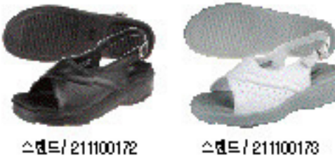
스탠드 / 211100172 스탠드 / 211100173