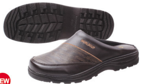
오픈스 슬리퍼 / 211600284