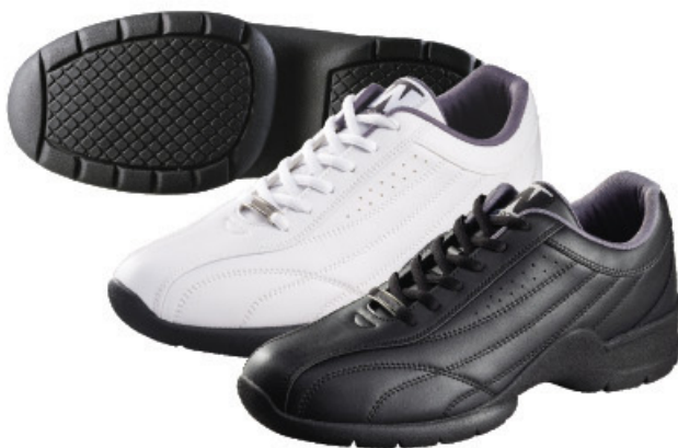
베이직08 라이프스타일 / 210878310 • 210878410