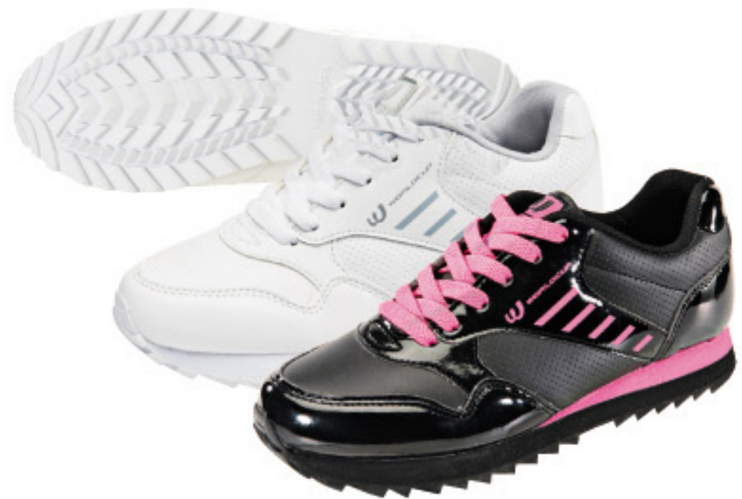
필드L2 스니커즈 / 211300071 • 211300070

■색 상 : 백색·흑색 ■소 재 : 갑피-합성피혁, 아웃솔-EVA+고무창 ■사이즈 : 230 | 235 | 240 | 245 | 250