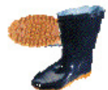
미션남공 / 211200232