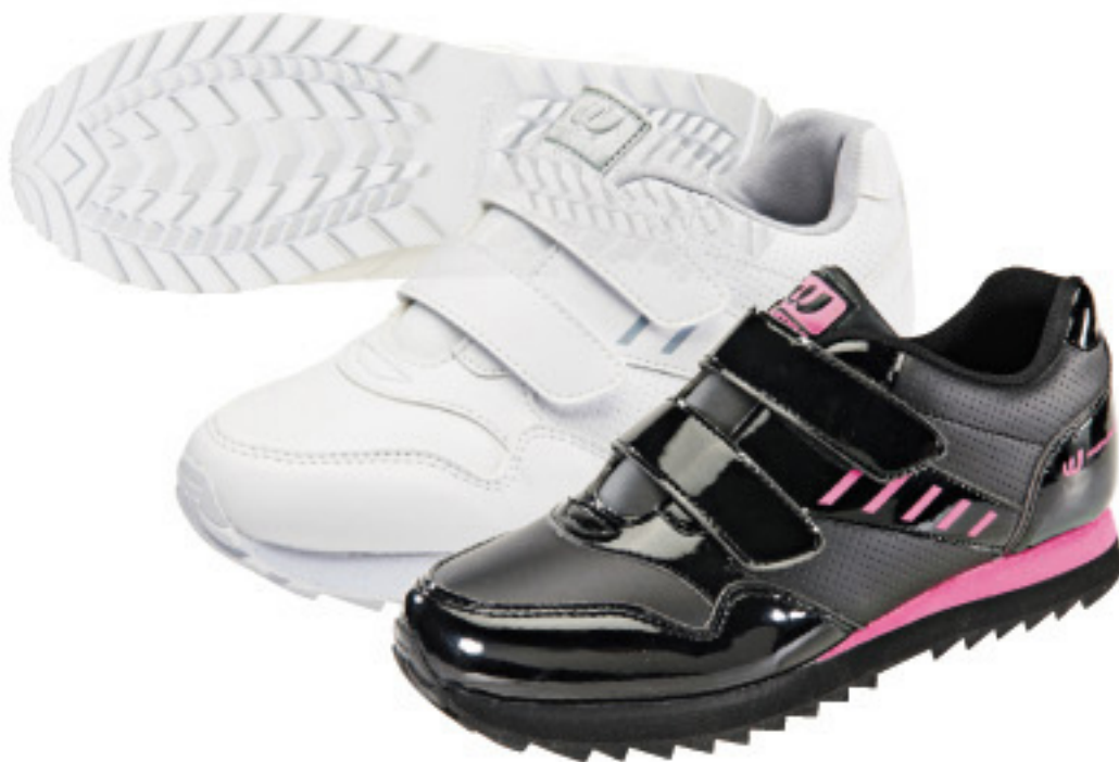
필드2 스니커즈 / 211300069 • 211300068

■색 상 : 적색 ■소 재 : 갑피-캔버스(면)+합성피혁, 아웃솔-파일론+고무창 ■사이즈 : 230 | 235 | 240 | 245 | 250