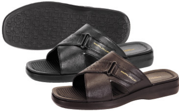
크라이 슬리퍼 / 211600030 • 211600031

심플하고 베이직한 갑피 디자인에 쿠셔닝이 우수한 우레탄 아웃솔을 접목시킨 머스트헤브 남성인 슬리퍼