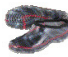
미션슬리퍼 / 211200085