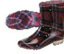
미션반공 / 211600123