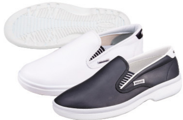
코사인 헤리티지 / 210062210 • 210062310