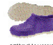
코드W하이 / 211600153