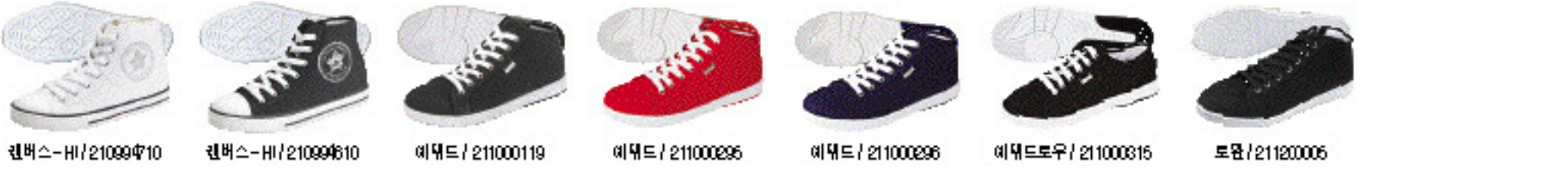
캔버스-HI / 210994710 캔버스-HI / 210994610 에딧드 / 211000119 에딧드 / 211000296 에딧드 / 211000296 에딧드트루 / 211000315 로원 / 211200006