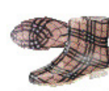
미션여화 / 211400046