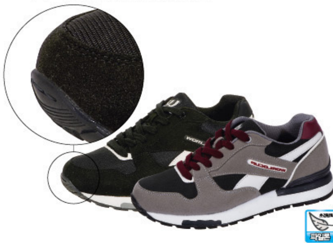
리바로 스니커즈 / 211500202 • 211500203

클래식한 패턴에 트렌디한 색감을 접목시켜 헤리티지 감성을 모던하게 구현한 갑피에 파일론 창의 적용으로 가볍고 착화감이 우수한 패션 조깅화