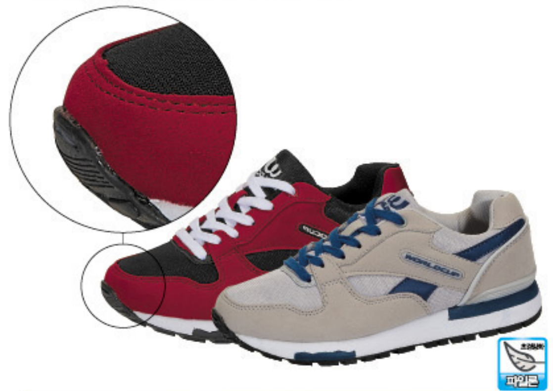
리바로16 스니커즈 / 211600017 • 211600019

클래식한 패턴에 트렌디한 색감을 접목시켜 헤리티지 감성을 모던하게 구현한 갑피에 파일론 창의 적용으로 가볍고 착화감이 우수한 패션 조깅화