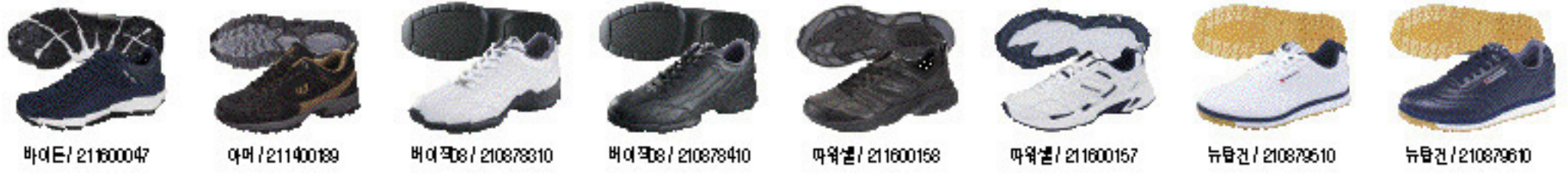
바이트 / 21160047 아미 / 21140189 바이작08 / 210878310 바이작08 / 210878410 파워셀 / 211600158 파워셀 / 211600157 뉴딤전 / 210879610 뉴딤전 / 210879610