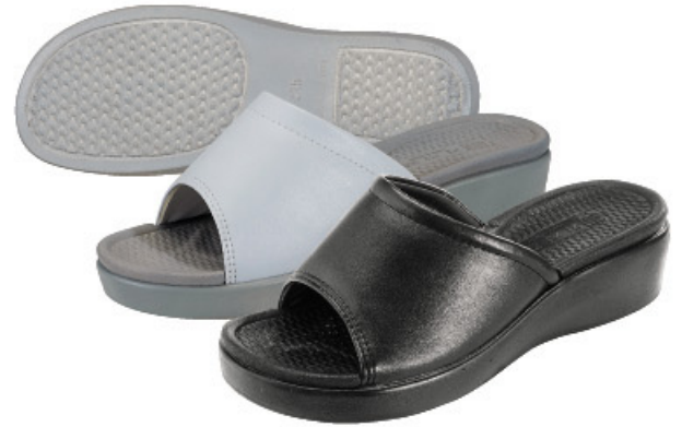
아모스 슬리퍼 / 211600117 • 211300129

우레탄 2중창 구조를 적용하여 착화감이 매우 뛰어난 심플한 갑피의 기본형 슬리퍼 (4cm굽높이)