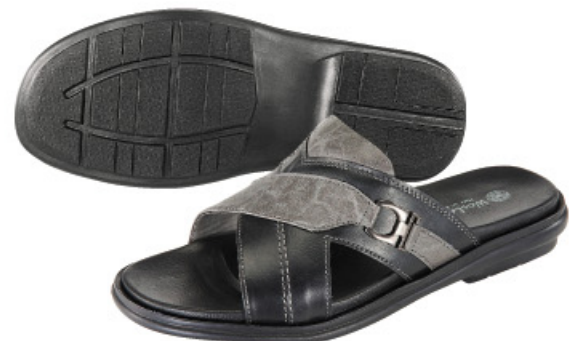
루카 슬리퍼 / 211300110

비조 장식을 포인트로 적용하였으며 우레탄 미드솔을 사용하여 착화감이 우수한 캐주얼 슬리퍼