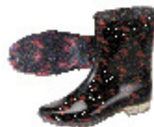
미션반공 / 211600124