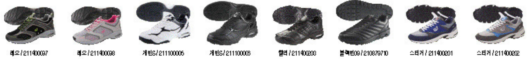
레오 / 21140097 레오 / 21140098 케빈S / 21110006 케빈S / 21110008 알라 / 21140028 블랙벤09 / 21087970 스타커 / 21140021 스타커 / 21140022