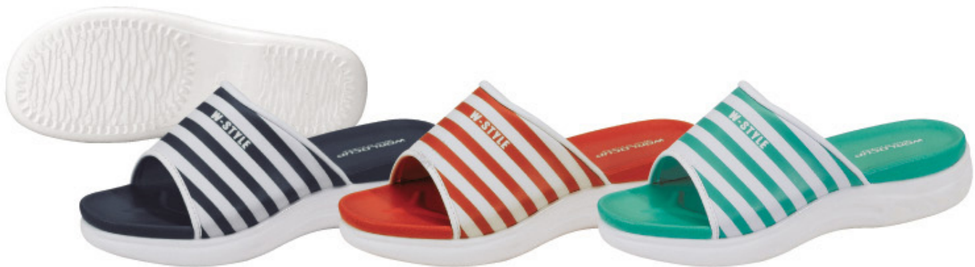
플렉스 슬리퍼 / 211200132 • 211200133 • 211600138

PU 이중창을 사용하여 폭신하고 부드러운 착화감과 시원한 스트라이프 무늬가 포인트인 여성용 슬리퍼