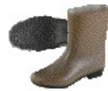
미션반공 / 211200082