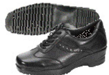
[211500245] 핫피스 흑색 / 225~250mm(5mm)