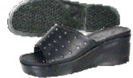
[211500096] 데이즈H 흑색 / 225~250mm(5mm)