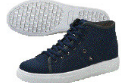
[211500046] 캐럿 곤색 / 225~250mm(5mm)