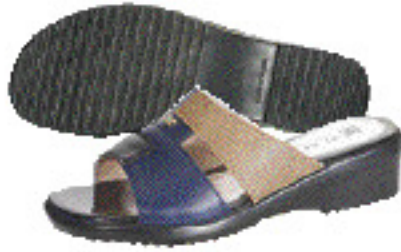
[211500099] 가든 흑색 / 225~250mm(5mm)