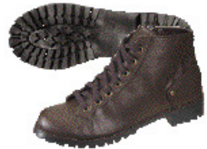
[211300203] 토냐 밤색 / 225~250mm(5mm)