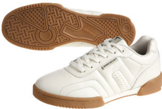
● 틀러S ● 헤리티지 / 211100001

클래식한 디자인에 가벼운 EVA 미드솔과 아리안스의 견고함이 조화된 사계절용 성인 편리화