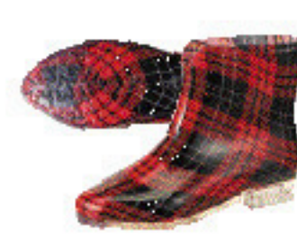
패션여화 / 211400045