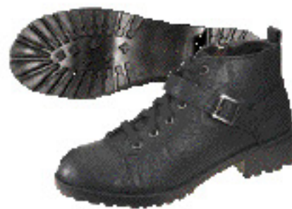
[211300204] 리즐 흑색 / 225~250mm(5mm)