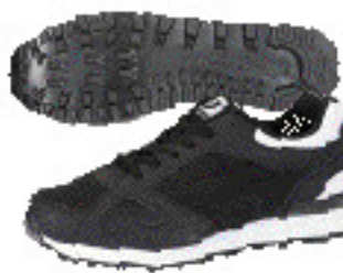
언더레이 / 211600023