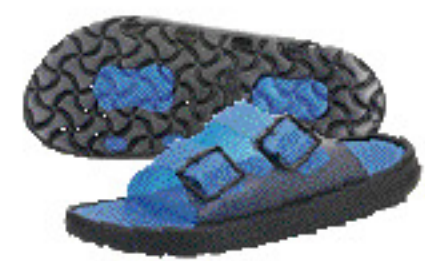
[211500067] 제롬 청색 / 240~280mm(10mm)