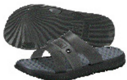
[211500068] 휴고 흑색 / 250~280mm(5mm)