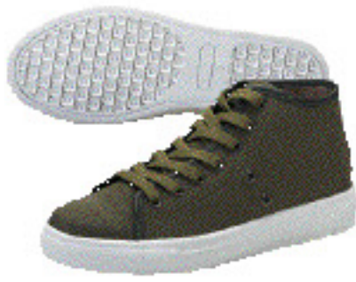
[211500047] 캐럿 카키색 / 225~250mm(5mm)