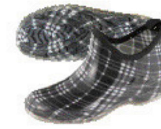
투명단화 / 211200084