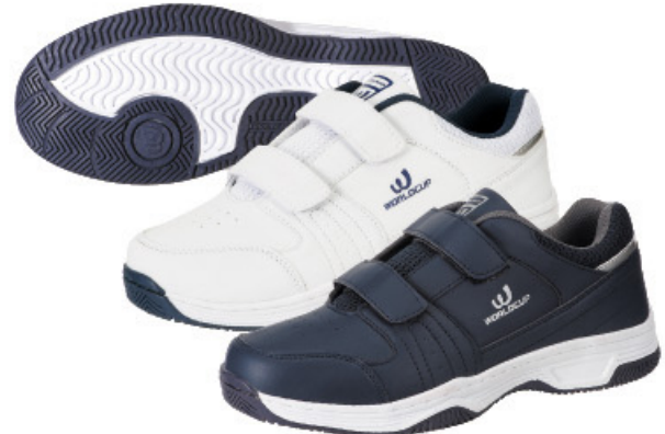
● 제코V ● 헤리티지 / 211400018 • 211400019

Heritage 라인의 클래식한 디자인이 접목된 벨크로 스타일의 사계절 성인 남성화. 아리안스로 공법으로 마무리하여 내구성이 뛰어난 신발