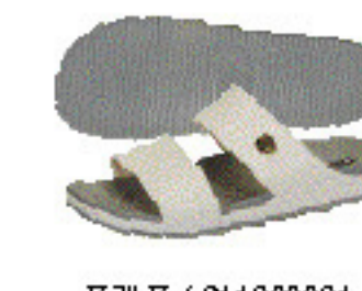
플랫 폼 / 211600061