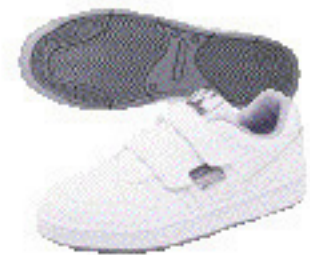
내셔널투09 / 210982610