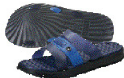
[211500069] 휴고 곤색 / 250~280mm(5mm)