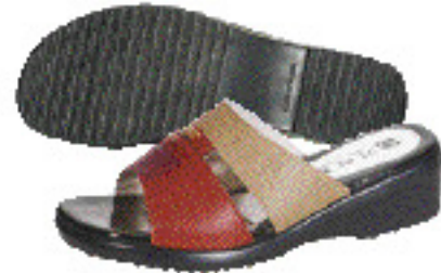
[211500100] 가든 적색 / 225~250mm(5mm)