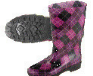
패션장화 / 211200074