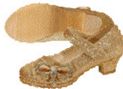
[211500216] 아리엘 골드 / 170~210mm(10mm)