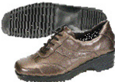
[211500247] 핫피스 골드 / 225~250mm(5mm)