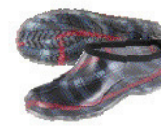
패션슬리퍼 / 211200085