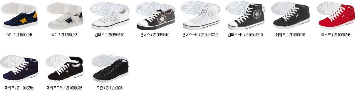
쇼미 / 211500236