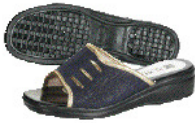
[211500098] 리보스 청색 / 225~250mm(5mm)