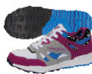
클로저W / 211600040