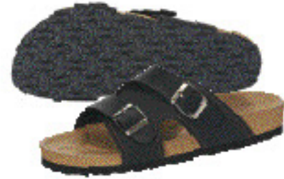
[211500139] 바티칸A 흑색 / 240~280mm(10mm)