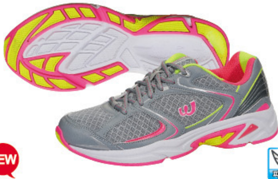
슈프림 스니커즈 / 211600113

■색 상 : 회오렌지 ■소 재 : 갑피-합성피혁+메쉬, 아웃솔-파일론+고무창 ■사이즈 : 250 | 255 | 260 | 265 | 270 | 275 | 280