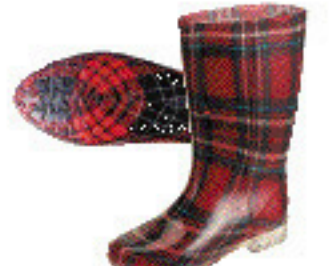
패션장화 / 211400043