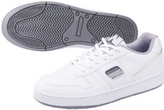
● 내셔널09 ● 헤리티지 / 210982410

클래식한 디자인에 내마모성이 뛰어난 RUBBER-OUTSOLE의 저가 스포츠화 (LACE-STYLE)