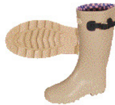
[211300155] 패션레인부츠 아이보리 / 230~255mm(5mm)