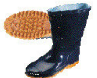
패션남장 / 211200232