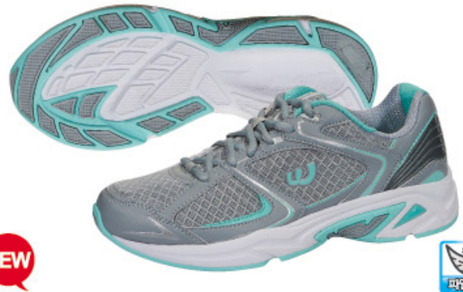
슈프림 스니커즈 / 211600114

■색 상 : 회핑크 ■소 재 : 갑피-합성피혁+메쉬, 아웃솔-파일론+고무창 ■사이즈 : 230 | 235 | 240 | 245 | 250