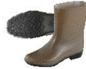
패션반장 / 211200082