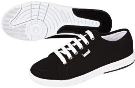
● 에뛰드로우 ● 캔버스 / 211000315

선명한 색상의 코튼을 사용하여 귀엽고 발랄한 이미지가 돋보이며, 10mm키높이 인솔사용으로 폭신폭신하여 착용감이 우수한 주니어스트리트 패션스니커즈