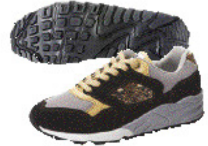
[211400172] 슬릭 회색 / 230~250mm(5mm)