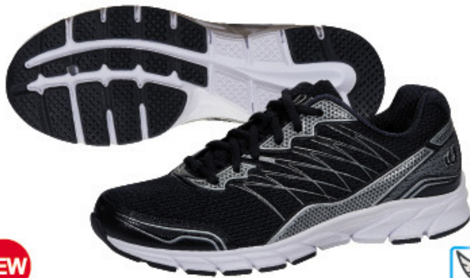
쉬프트 스니커즈 / 211600110

통기성이 우수한 메쉬를 사용한 갑피에 세련된 나염을 접목시켜 세련되면서도 모던한 감성의 조깅화