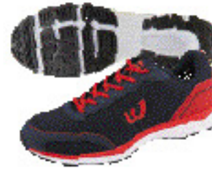
리바로W / 211500195