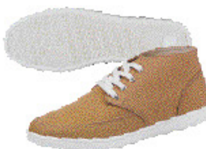
[211400054] 제레미 밤색 / 250~280mm(5mm)