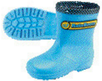
아동장화 / 211300149