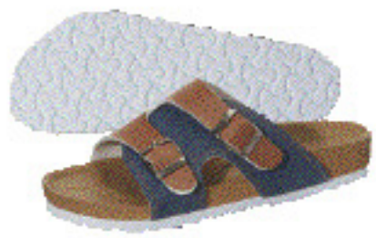
[211500138] 바티칸A 청색 / 240~280mm(10mm)