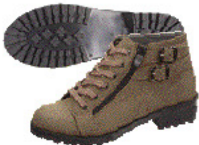
[211400223] 카이 베이지 / 225~250mm(5mm)