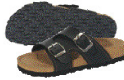
[211500137] 바티칸 흑색 / 180~230mm(10mm)