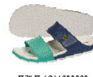
플랫 폼 / 211600060