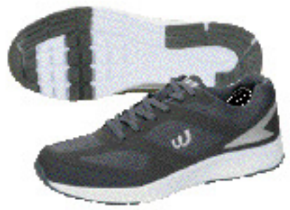
[211500206] 비드 회색 / 250~280mm(5mm)