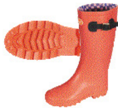
[211300154] 패션레인부츠 적색 / 230~255mm(5mm)