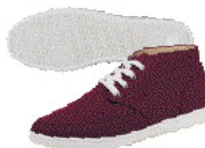
[211400053] 제레미 와인색 / 250~280mm(5mm)