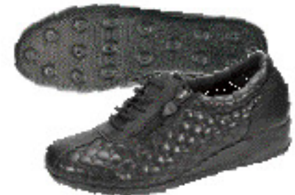
[211500244] 스티치 흑색 / 225~250mm(5mm)