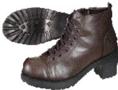
[211300209] 도리스 밤색 / 225~250mm(5mm)