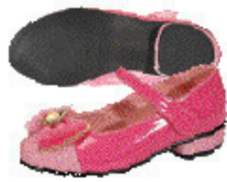
바세린 / 21160096