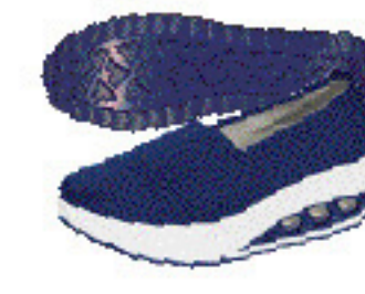
데님 / 211600105