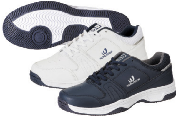
● 제코 ● 헤리티지 / 211400016 • 211400017

Heritage 라인의 클래식한 디자인이 접목된 사계절 성인 남성화. 아리안스로 공법으로 마무리하여 내구성이 뛰어난 신발