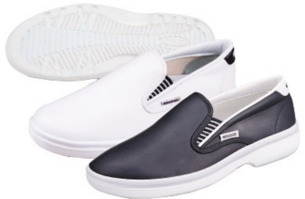
● 코사인 ● 헤리티지 / 210062210 • 210062310