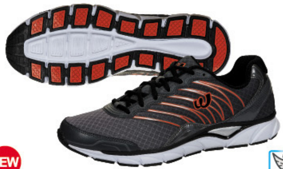
트릭 스니커즈 / 211600112

■색 상 : 곤색 ■소 재 : 갑피-합성피혁+메쉬, 아웃솔-파일론+고무창 ■사이즈 : 250 | 255 | 260 | 265 | 270 | 275 | 280