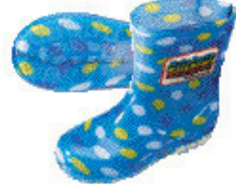
레인부츠2 / 211200188