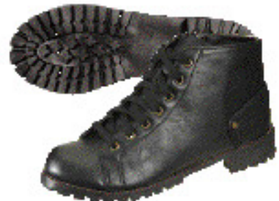
[211300202] 토냐 흑색 / 225~250mm(5mm)