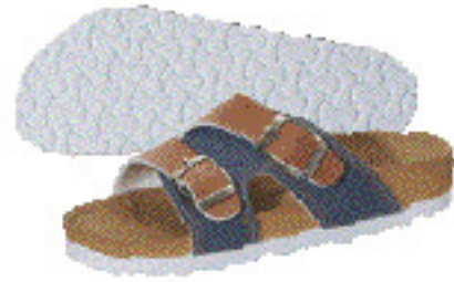
[211500136] 바티칸 청색 / 180~230mm(10mm)