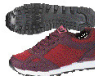
언더레이W / 211600042