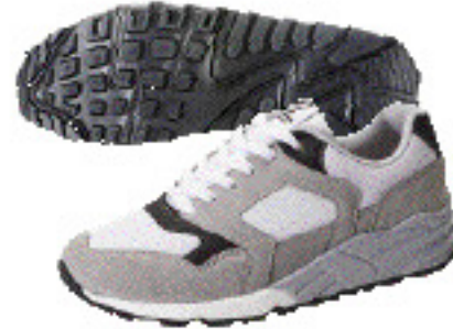
[211400173] 슬릭 흑색 / 230~250mm(5mm)