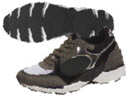
[211400199] 파샤 백밤색 / 225~275mm(5mm)