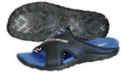
[211500090] 브랜드 흑청색 / 190~240mm(5mm)