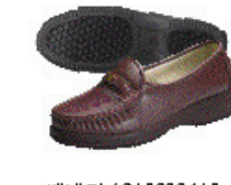
베네타 / 210996410