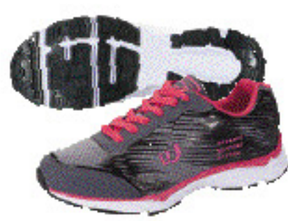
[211400174] 트랙스W 회핑크 / 230~250mm(5mm)