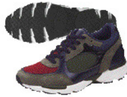
[211400198] 파샤W 녹적색 / 225~250mm(5mm)