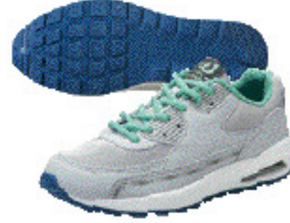
[211500014] 페로 회민트 / 230~250mm(5mm)