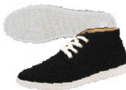
[211400052] 제레미 흑색 / 250~280mm(5mm)