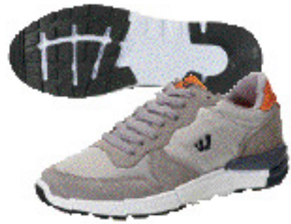
[211500087] 타이곤 회오렌지 / 250~280mm(5mm)