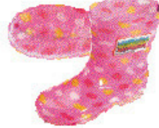
레인부츠2 / 211200189