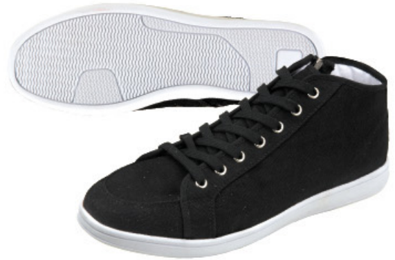
● 로완 ● 캔버스 / 211200005

블랙 면소재를 사용한 베이직한 디자인으로 어핀 스타일에도 코디가 가능한 HI-STYLE 캔버스화