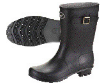
[211400106] 패션레인부츠MID 흑색 / 220~255mm(5mm)