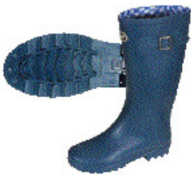
[211300153] 패션레인부츠 곤색 / 230~255mm(5mm)