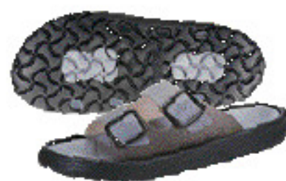
[211500066] 제롬 회색 / 240~280mm(10mm)