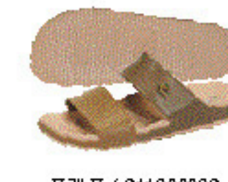
플랫 폼 / 211600062