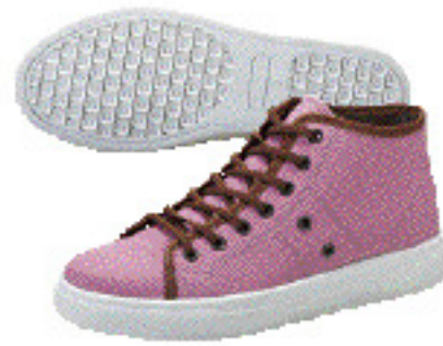
[211500048] 캐럿 핑크색 / 225~250mm(5mm)