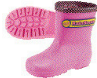
아동장화 / 211300150