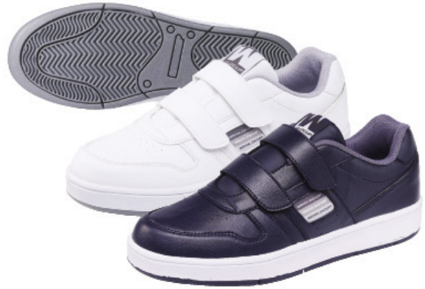
● 내셔널투09 ● 헤리티지 / 210982610 • 210982710

클래식한 디자인에 내마모성이 뛰어난 RUBBER-OUTSOLE의 저가 스포츠화 (VELCRO-STYLE)