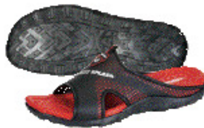
[211500091] 브랜드 흑적색 / 190~240mm(5mm)