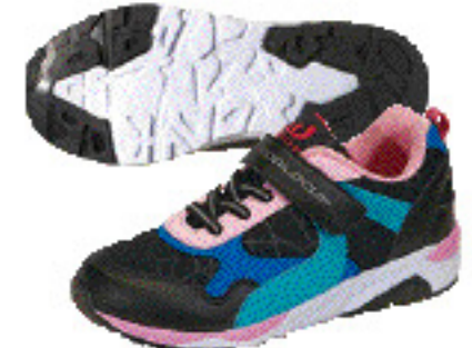
[211500185] 올바스 흑핑크 / 200~240mm(10mm)