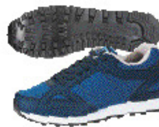
언더레이 / 211600024