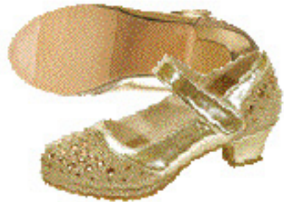
[211500229] 스쿼어 골드 / 170~210mm(10mm)