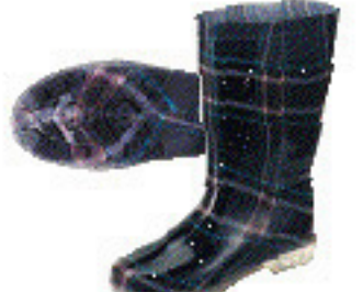
패션장화 / 211400044