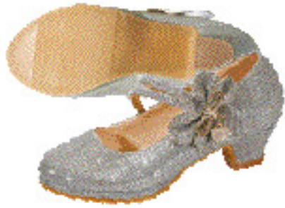
[211500217] 로리나 은색 / 170~210mm(10mm)