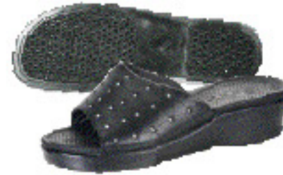
[211500095] 데이즈 흑색 / 225~250mm(5mm)