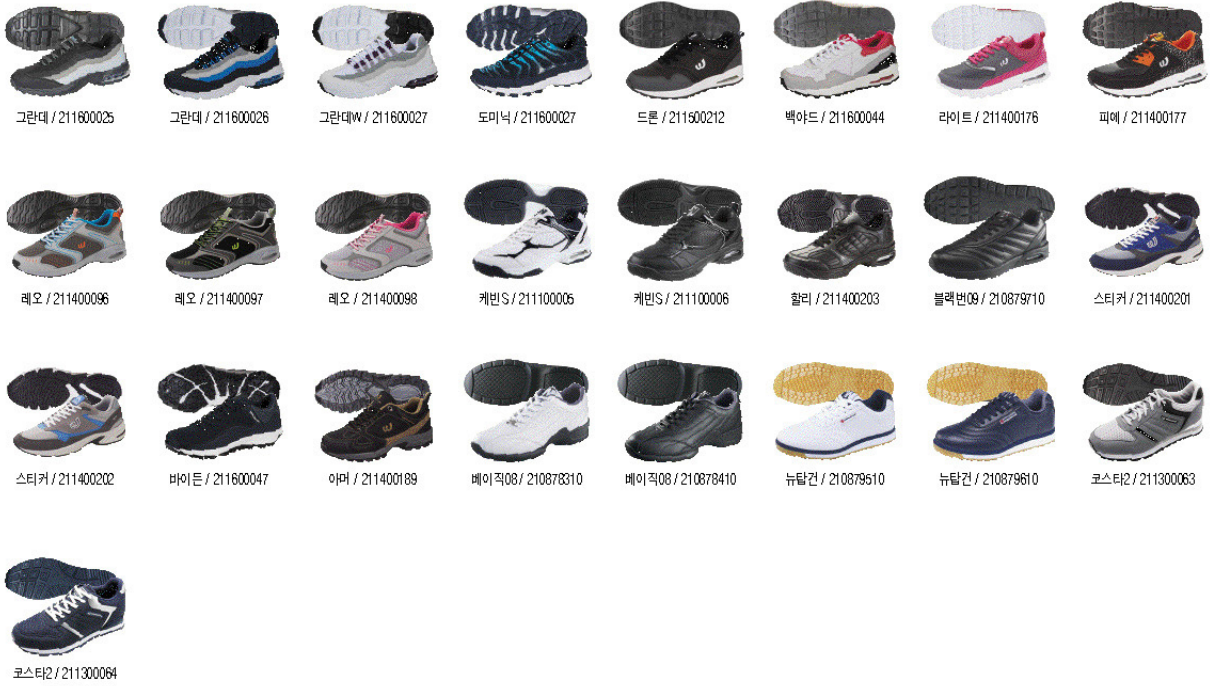
그란데 / 211600025