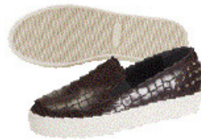
[211400217] 솔트 밤색 / 225~250mm(5mm)