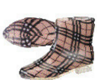
패션여화 / 211400046