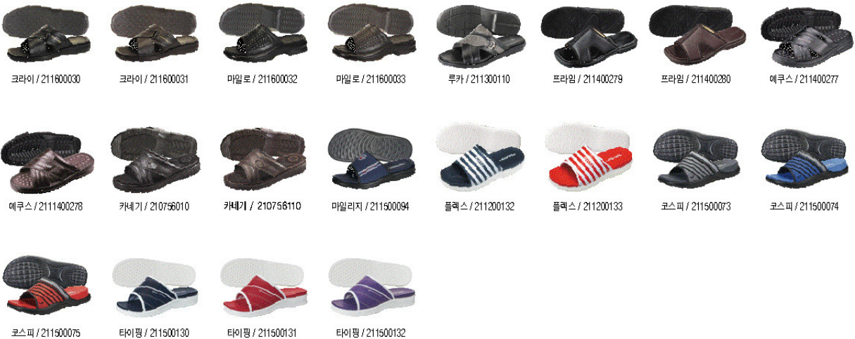
크라이 / 211600030