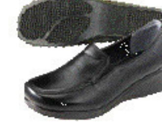
아이시스 / 211200063