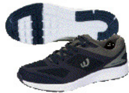
[211500207] 비드 곤색 / 250~280mm(5mm)