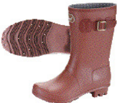
[211400107] 패션레인부츠MID 적색 / 220~255mm(5mm)