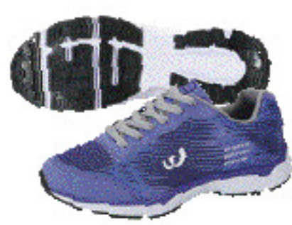
[211400175] 트랙스W 보라색 / 230~250mm(5mm)