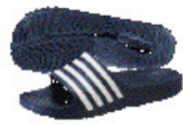
슬라이드 / 211600204