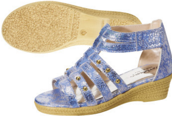
샤미즈 아동화 / 211500124

■색 상 : 핑크색 ■소 재 : 갑피-PVC, 아웃솔-PVC ■사이즈 : 160 | 170 | 180 | 190 | 200 | 210