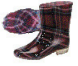
레션반장 / 211600123