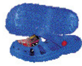
트레 인포스EVA샌달 / 211600090