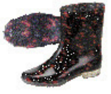
레션반장 / 211600124