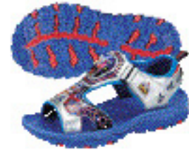
트레 인포스샌달 / 211600144