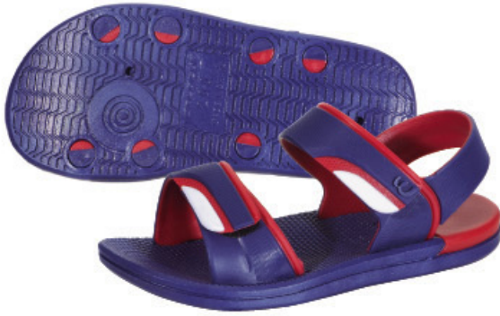
스쿠터 아동화 / 211500119

벨크로 스트랩으로 편안한 착용이 가능하며 PVC 소재를 사용하여 접지력이 뛰어난 아동 샌들