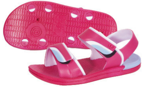
스쿠터 아동화 / 211500120

■색 상 : 곤/적색 ■소 재 : 갑피-PVC, 아웃솔-PVC ■사이즈 : 160 | 170 | 180 | 190 | 200 | 210