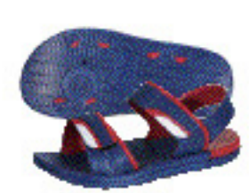
스쿠터 / 211500119