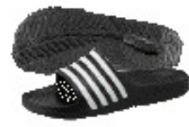
슬라이드 / 211600202