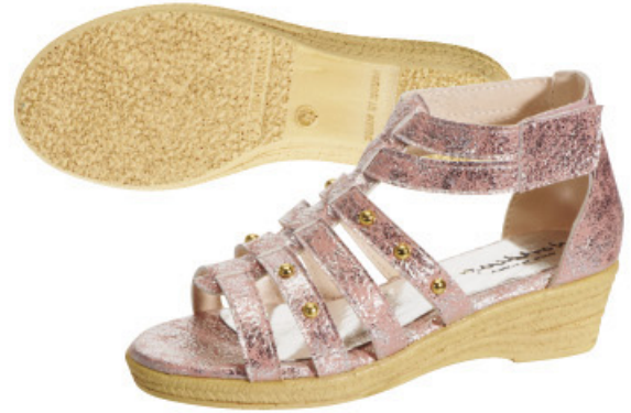
샤미즈 아동화 / 211500123

■색 상 : 청색 ■소 재 : 갑피-합성피혁, 아웃솔-PU창 ■사이즈 : 190 | 200 | 210 | 220 | 230