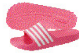
슬라이드W / 211600206