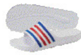
슬라이드 / 211600203