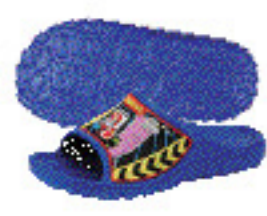
트레 인포스비치슬리퍼 / 211600145