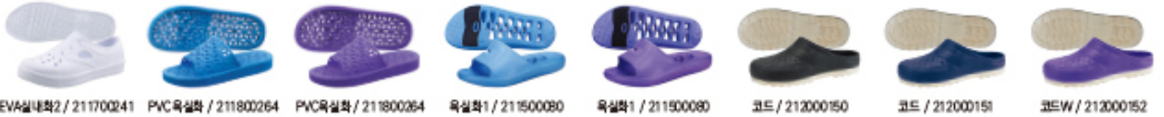
EVA실내화2 / 211700241 PVC목실화 / 211800264 PVC목실화 / 211800264 목실화1 / 211500080 목실화1 / 211500080 코드 / 212000150 코드 / 212000151 코드W / 212000152