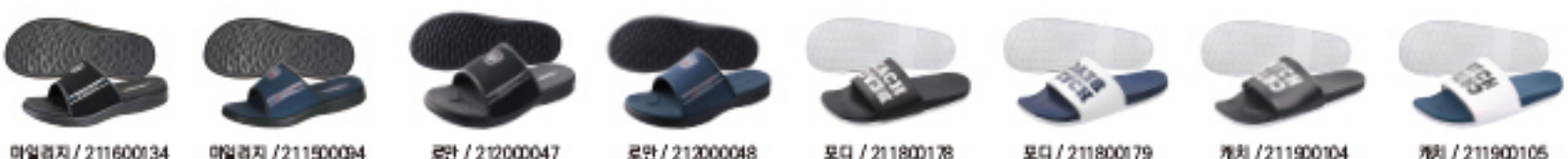
마일리지 / 211600134 마일리지 / 211500094 로만 / 212000047 로만 / 212000048 모디 / 211800178 모디 / 211800179 캐치 / 211900104 캐치 / 211900105