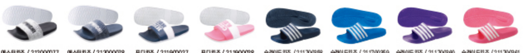
에스티키즈 / 212000077 에스티키즈 / 212000078 모디키즈 / 211900027 모디키즈 / 211900028 슬라이드키즈 / 211700358 슬라이드키즈 / 211700359 슬라이드키즈 / 211700360 슬라이드키즈 / 211700361