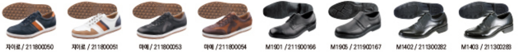
자이로 / 211800050 자이로 / 211800051 마에 / 211800053 마에 / 211800054 M1901 / 211900166 M1905 / 211900167 M1402 / 211300282 M1403 / 211300283