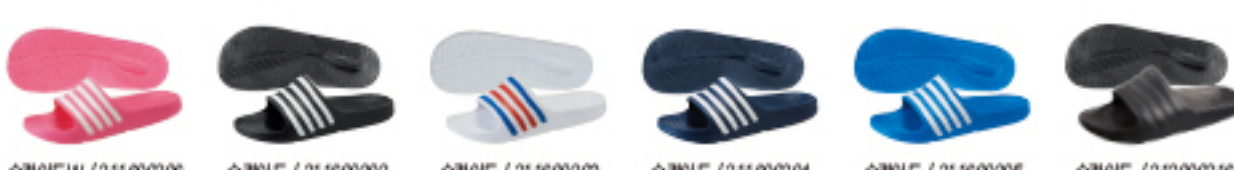
슬라이드W / 211600206 슬라이드 / 211600202 슬라이드 / 211600203 슬라이드 / 211600204 슬라이드 / 211600205 슬라이드 / 212000216