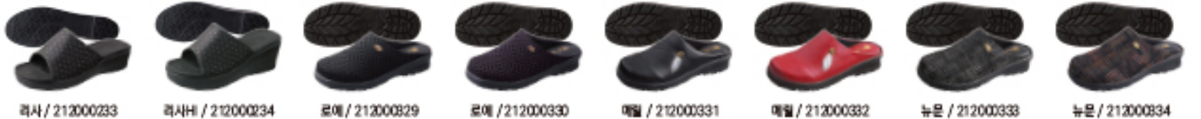
리사 / 212000233 리사H / 212000234 로에 / 212000329 로에 / 212000330 메릴 / 212000331 메릴 / 212000332 뉴문 / 212000333 뉴문 / 212000334