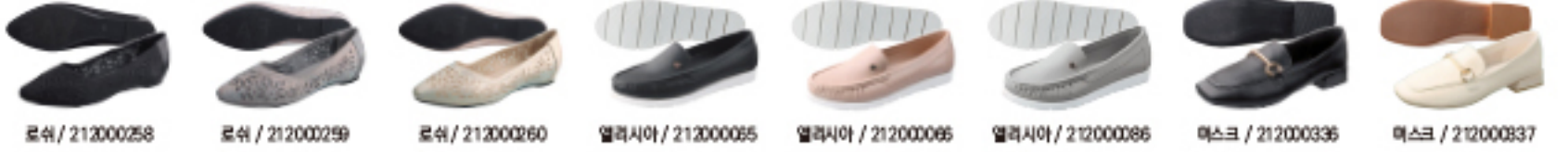
로쉬 / 212000258 로쉬 / 212000259 로쉬 / 212000260 엘러시아 / 212000055 엘러시아 / 212000065 엘러시아 / 212000086 마스크 / 212000336 마스크 / 212000337