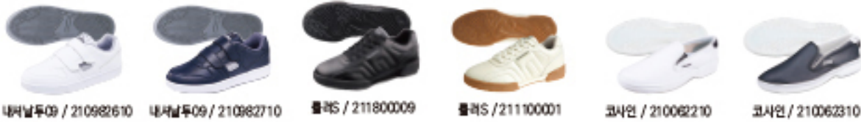
내셔널두09 / 210982610 내셔널두09 / 210982710 플러S / 211800009 플러S / 211100001 코스인 / 210062210 코스인 / 210062310