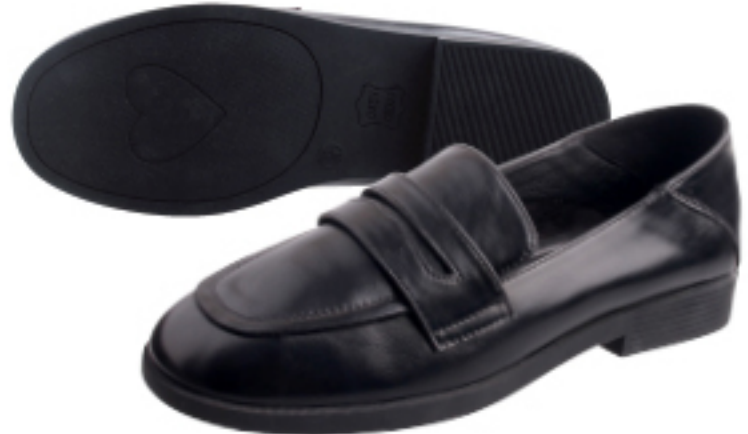
로피 캐주얼 / 212000068

부드러운 합성피혁 소재를 사용하여 착화감이 우수하고, 뒤꿈치를 접어서 볼로퍼 형태로 신을 수 있는 1켠2조의 여성 기본 페니로퍼