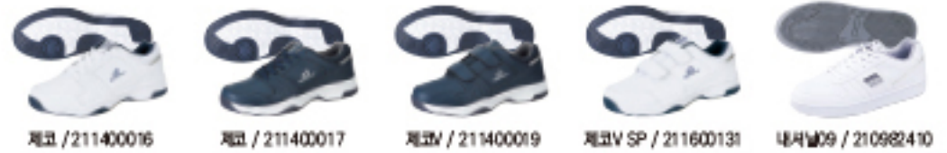
제코 / 211400016 제코 / 211400017 제코V / 211400019 제코V SP / 211600131 내셔널09 / 210982410