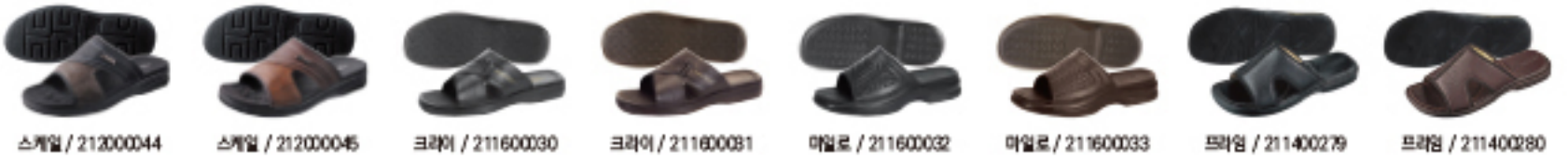
스케일 / 212000044 스케일 / 212000045 크라이 / 211600030 크라이 / 211600031 마일로 / 211600032 마일로 / 211600033 프라임 / 211400279 프라임 / 211400280