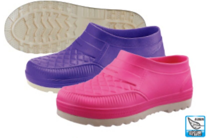
코드W하이 EVA / 212000156 • 212000157

발목까지 올라오는 패턴의 적용으로 생활방수 기능이 우수하여 가볍고 미끄럽지 않은 다용도의 EVA 신발 ■ 색 상 : 흑색 • 끈색 ■ 소 재 : 갑파-EVA, 아웃솔-PVC ■ 사이즈 : 230 | 240 | 250 | 260 | 270 | 280