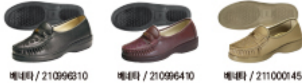
베네타 / 210996310 베네타 / 210996410 베네타 / 211000145