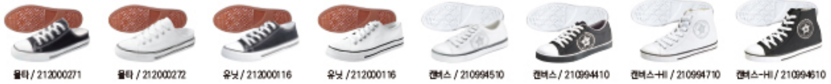
올타 / 212000271 올타 / 212000272 유닛 / 212000116 유닛 / 212000116 캔버스 / 210994510 캔버스 / 210994410 캔버스-Hi / 210994710 캔버스-Hi / 210994610