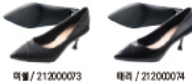
미엘 / 212000073 태라 / 212000074