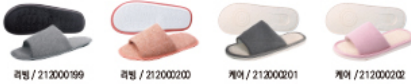
리빙 / 212000199 리빙 / 212000200 케어 / 212000201 케어 / 212000202