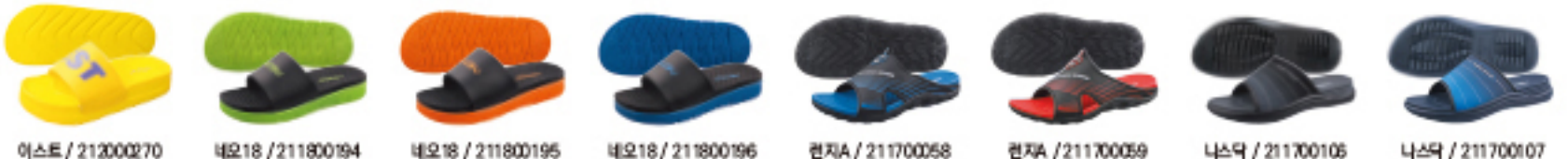
이스트 / 212000270 네오18 / 211800194 네오18 / 211800195 네오18 / 211800196 런자A / 211700058 런자A / 211700059 나스닥 / 211700105 나스닥 / 211700107