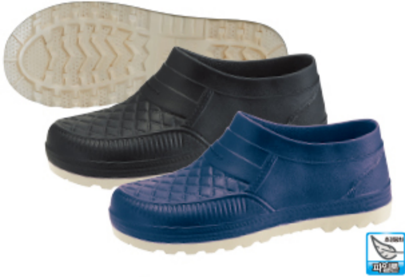
코드하이 EVA / 212000154 • 212000155

EVA 소재를 사용하여 가볍고 합성고무 아웃솔을 사용하여 미끄럼방지 기능이 있는 다용도의 EVA 슬리퍼 ■ 색 상 : 보라색 • 핑크색 ■ 소 재 : 갑파-EVA, 아웃솔-PVC ■ 사이즈 : 230 | 240 | 250