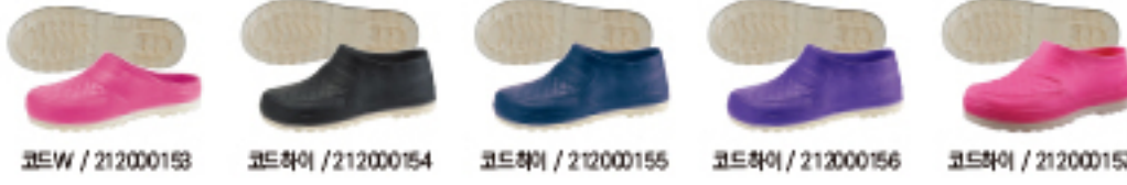
코드W / 212000153 코드하이 / 212000154 코드하이 / 212000155 코드하이 / 212000156 코드하이 / 212000157