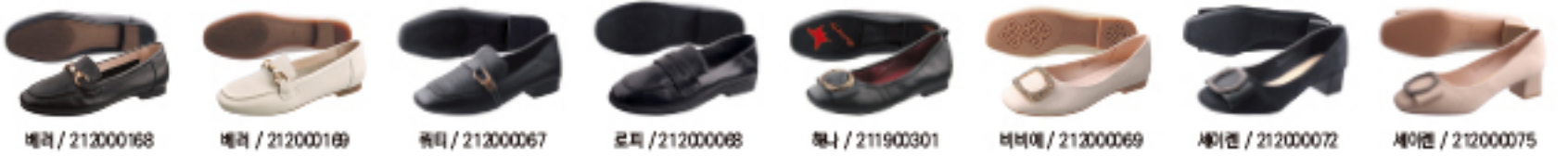
베라 / 212000168 베라 / 212000169 쉐티 / 212000067 로피 / 212000068 해나 / 211900301 버베에 / 212000069 세이렌 / 212000072 세이렌 / 212000075