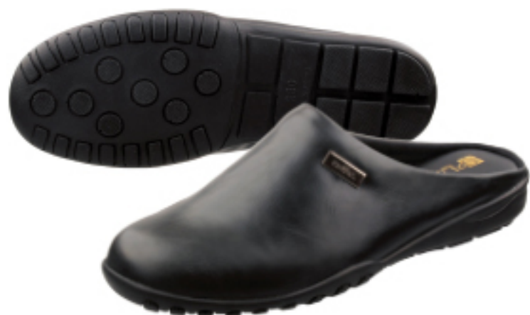
포체 슬리퍼 / 211900351