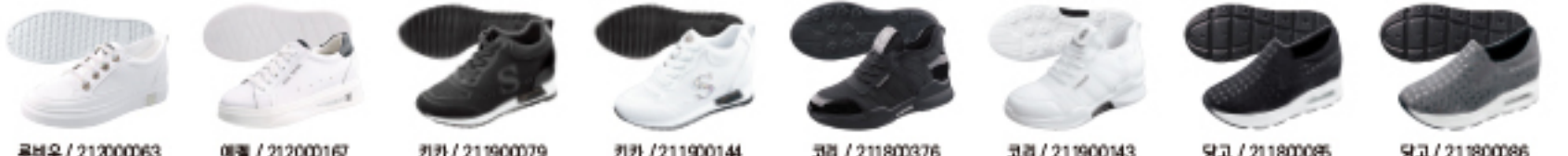
쿠버우 / 212000063 메릴 / 212000167 키카 / 211900079 키카 / 211900144 코라 / 211800376 코라 / 211900143 당고 / 211800085 당고 / 211800086