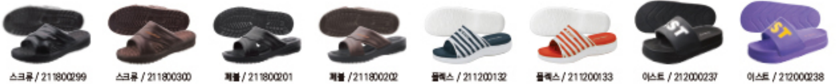
스크류 / 211800299 스크류 / 211800300 제발 / 211800201 제발 / 211800202 플렉스 / 211200132 플렉스 / 211200133 이스트 / 212000237 이스트 / 212000238