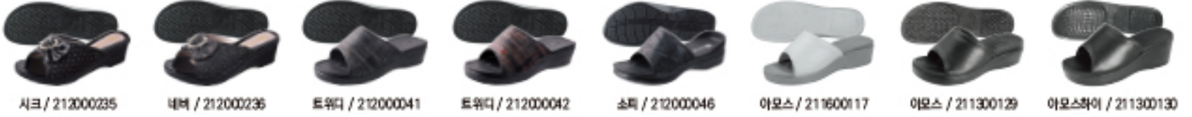
시크 / 212000235 네버 / 212000236 토워드 / 212000041 토워드 / 212000042 소피 / 212000046 아모스 / 211600117 아모스 / 211300129 아모스하이 / 211300130