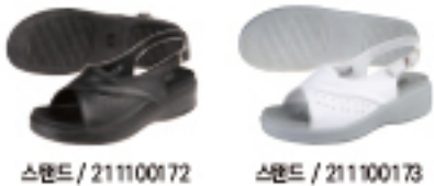
스탠드 / 211100172 스탠드 / 211100173