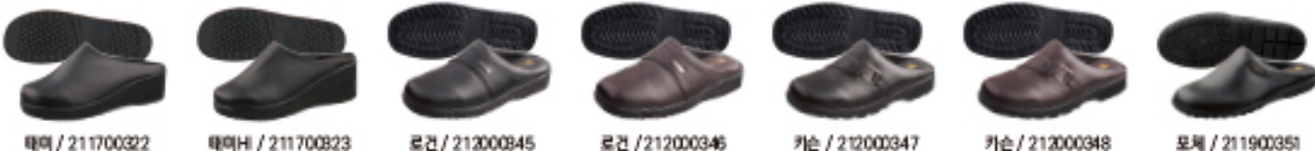
태머 / 211700322 태머H / 211700323 로진 / 212000345 로진 / 212000346 카슨 / 212000347 카슨 / 212000348 포제 / 211900351