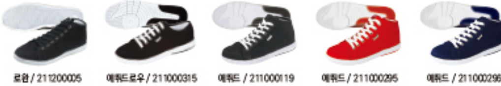
로완 / 211200005 에워드로우 / 211000315 에워드 / 211000119 에워드 / 211000295 에워드 / 211000296