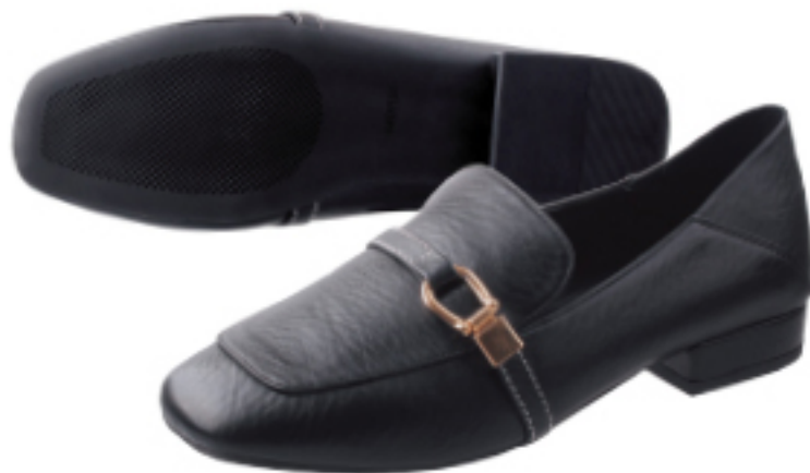
퀸티 캐주얼 / 212000067

부드러운 합성피혁 소재를 사용하여 착화감이 우수하고, 뒤꿈치를 접어서 볼로퍼 형태로 신을 수 있는 1켠2조의 여성 로퍼