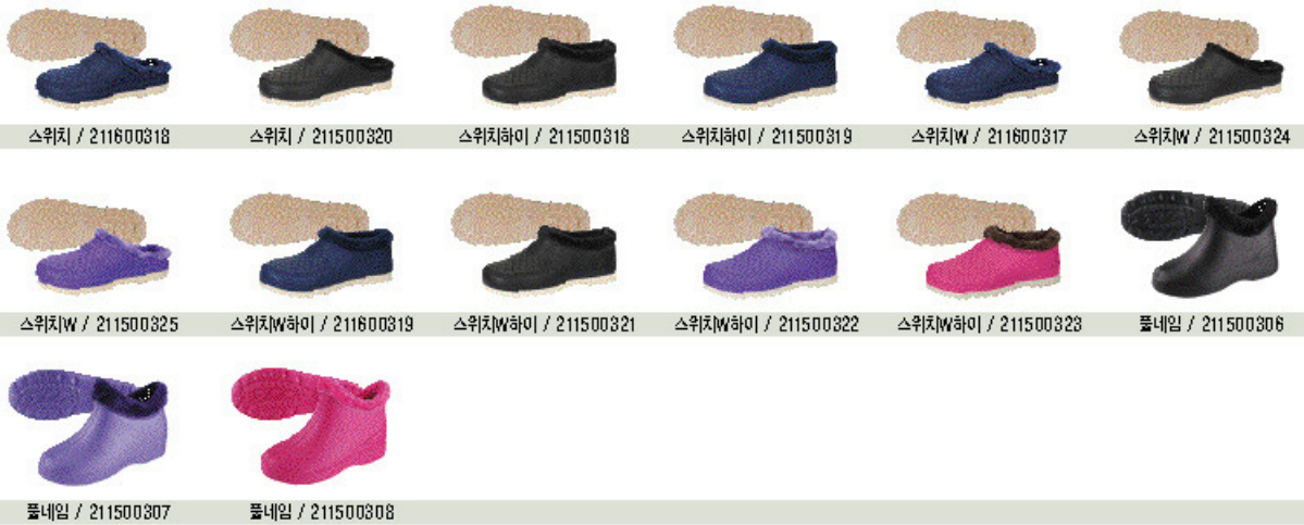
스위치 / 211600318 스위치 / 211500320 스위치하이 / 211500318 스위치하이 / 211500319 스위치W / 211600317 스위치W / 211500324