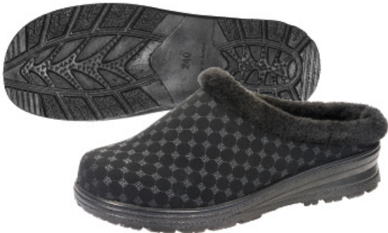
브로디 여성인슬리퍼 / 211500275

■색 상 : 암적색 ■소 재 : 갑피-합성피혁+보아, 아웃솔-PU창 ■사이즈 : 230 | 235 | 240 | 245 | 250 | 255