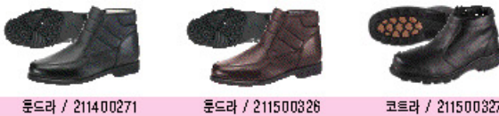
윈드라 / 211400271 윈드라 / 211500326 코트라 / 211500327