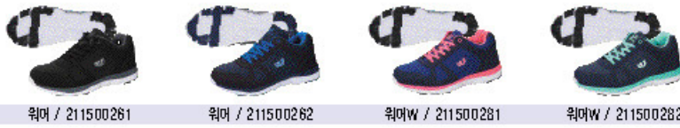
워머 / 211500261 워머 / 211500262 워머W / 211500281 워머W / 211500282