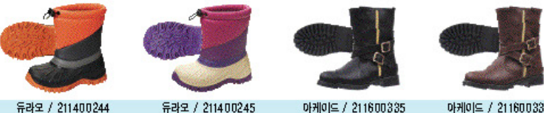
듀라오 / 211400244 듀라오 / 211400245 아케이드 / 211600335 아케이드 / 211600336