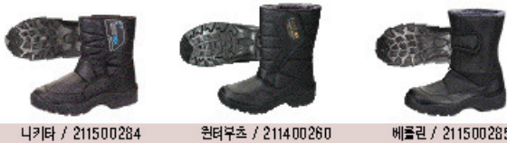
니키타 / 211500284 윈터부츠 / 211400260 베를린 / 211500285