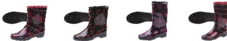
매션방한반장 / 211600327 매션방한반장 / 211600328 매션방한정화 / 211600329 매션방한정화 / 211600330