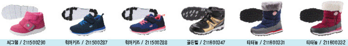
씨그림 / 211500290 워머키즈 / 211500287 워머키즈 / 211500288 꿀든뽀 / 211600347 티타눌 / 211600331 티타눌 / 211600332