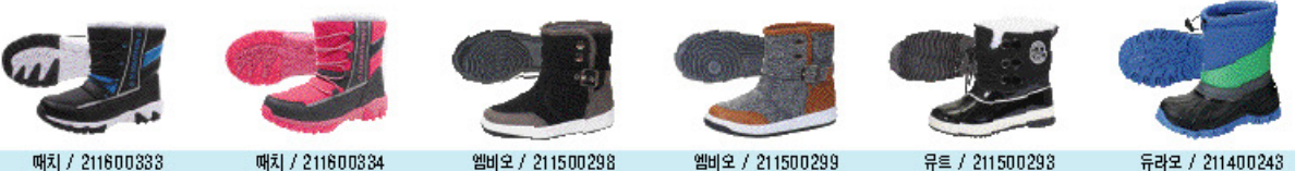
매치 / 211600333 매치 / 211600334 엠비오 / 211500298 엠비오 / 211500299 유트 / 211500293 듀라오 / 211400243