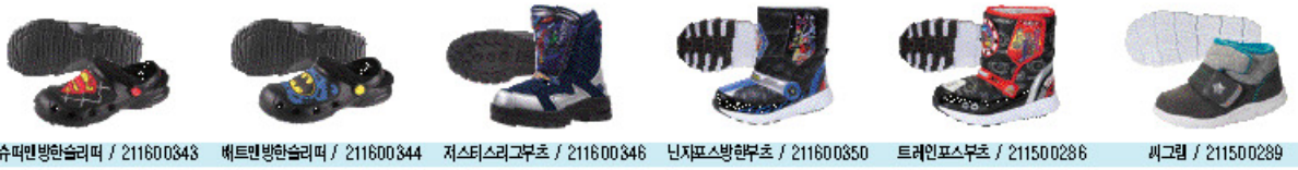
슈퍼맨방한슬리퍼 / 211600343 벼트맨방한슬리퍼 / 211600344 저스티스리그부츠 / 211600346 닌자프스방한부츠 / 211600350 트레인프스부츠 / 211500286 씨그림 / 211500289