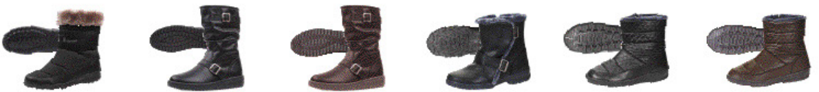
립스터 / 211600337 벨라 / 211600348 벨라 / 211600349 뽀뽀 / 211500279 드로잉 / 211500310 드로잉 / 211500311