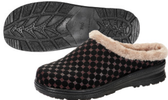
브로디 여성인슬리퍼 / 211500276

■색 상 : 흑색 ■소 재 : 갑피-합성피혁+보아, 아웃솔-PU창 ■사이즈 : 230 | 235 | 240 | 245 | 250 | 255