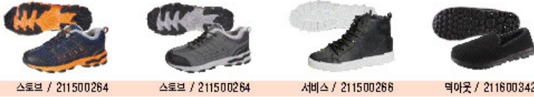
스트브 / 211500264 스트브 / 211500264 서비스 / 211500266 덕아웃 / 211600342